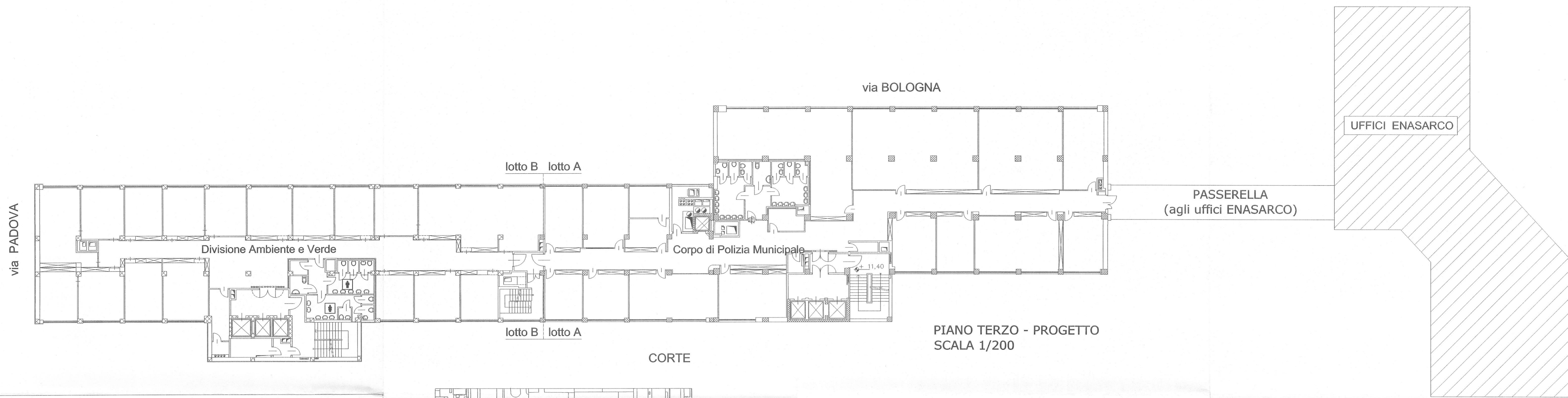
PIANO TERZO - PROGETTO SCALA 1/200