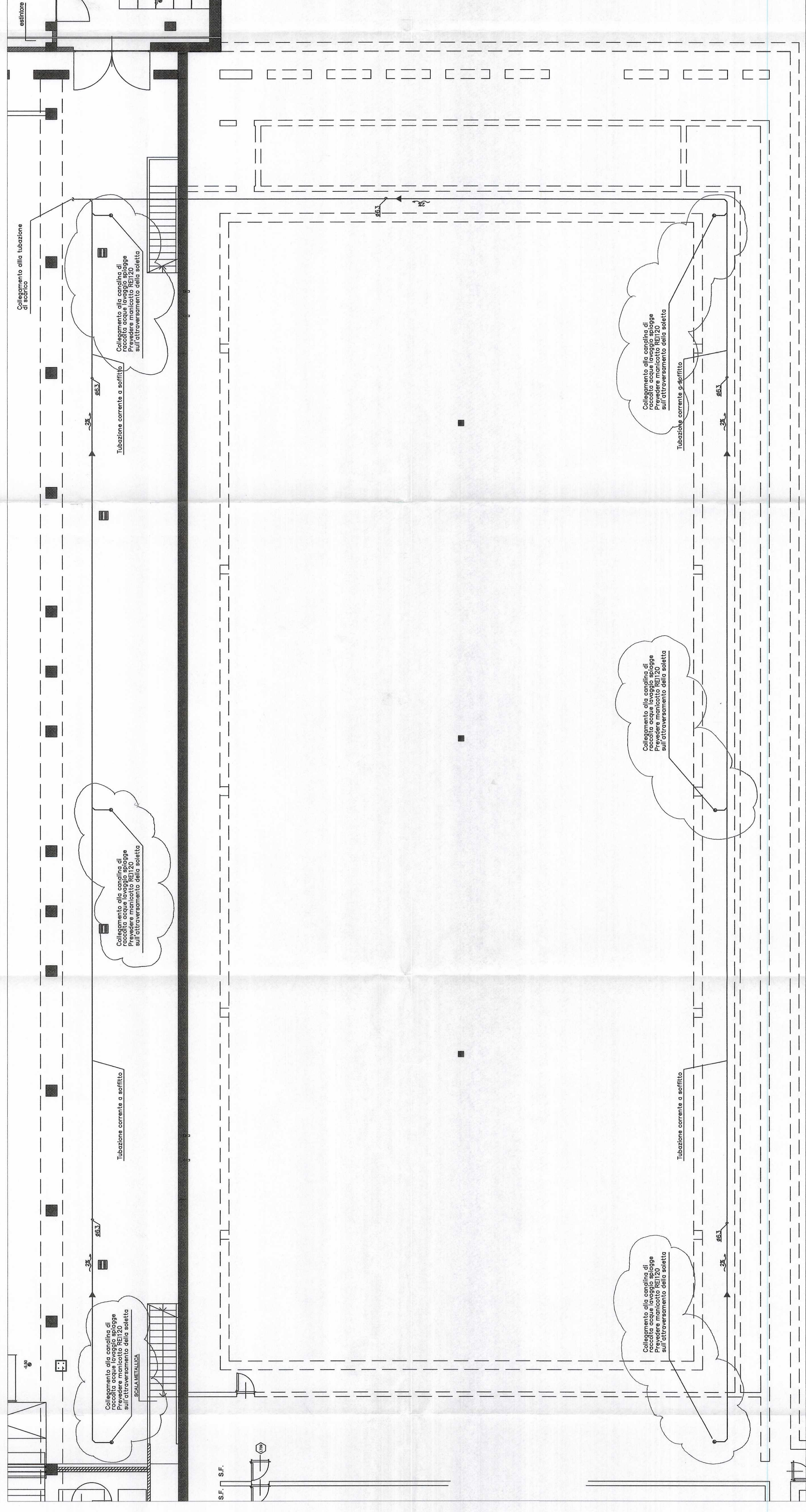
DISTRIBUZIONE TUBAZIONI RACCOLTA ACQUE PISCINA OLIMPIONICA LIVELLO -2 -Scala 1:100-