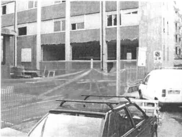
Vista del nuovo ingresso da Via Padova