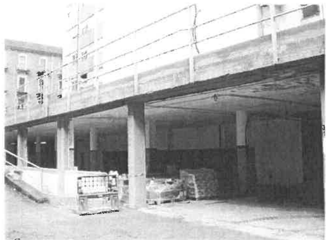
Vista del primo seminterrato della rampa verso Via Padova