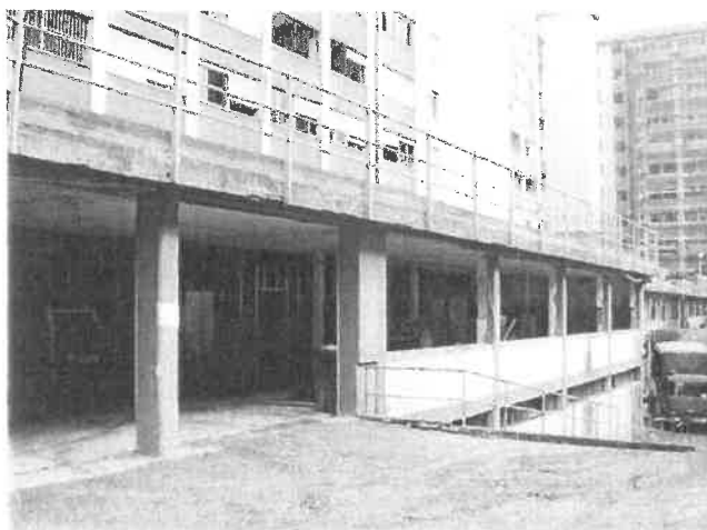
Vista del primo seminterrato della rampa verso Corso Novara