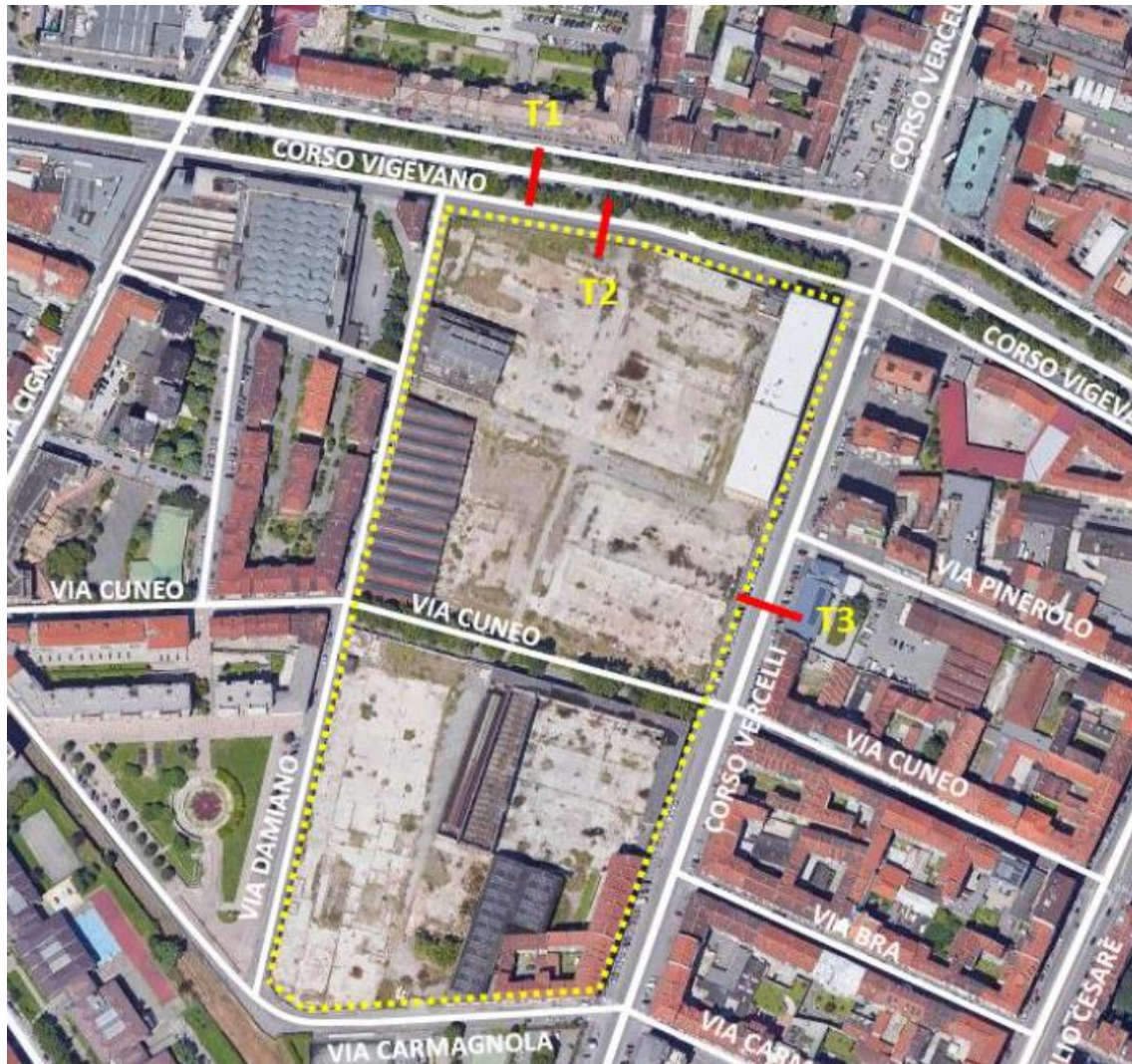
Assi viari oggetto di monitoraggio del traffico

I rilievi dovranno essere effettuati anche mediante l'utilizzo di videocamere MIOVISION o similari al fine di ricostruire le manovre di scambio tra le diverse correnti veicolari afferenti ai seguenti nodi stradali. I rilievi ai nodi devono essere effettuati per la fascia bioraria di punta della sera (17-19) del venerdì e del sabato dove si rilevano i picchi di funzionamento delle funzioni urbanistiche in previsione: