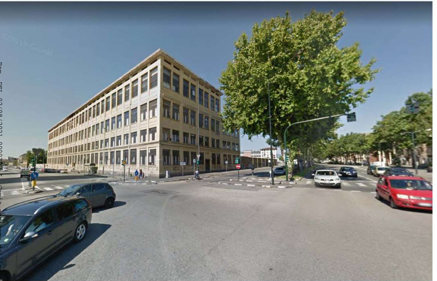
3. Corso Vigevano angolo corso Vercelli

. - Rep. DEL 02/08/2021.00007201 Copia conforme dell'originale sottoscritto digitalmente da BOETTI MAURO ANDRÈ. Si attesta che la presente copia digitale è conforme all'originale digitale ai sensi dell'art. 23-bis del D.Lgs. n. 82/2005. Il corrispondente documento informatico originale è conservato negli archivi di Comune di Torino