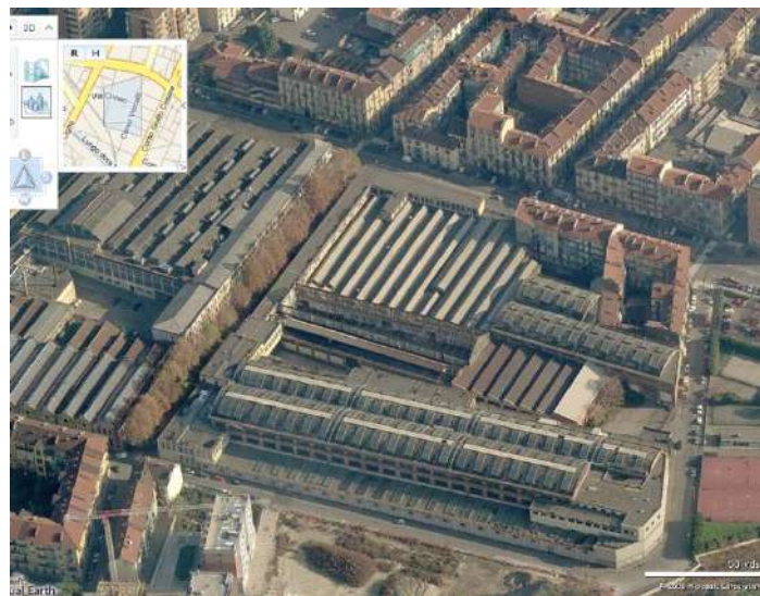
Vista aerea da ovest – area sud