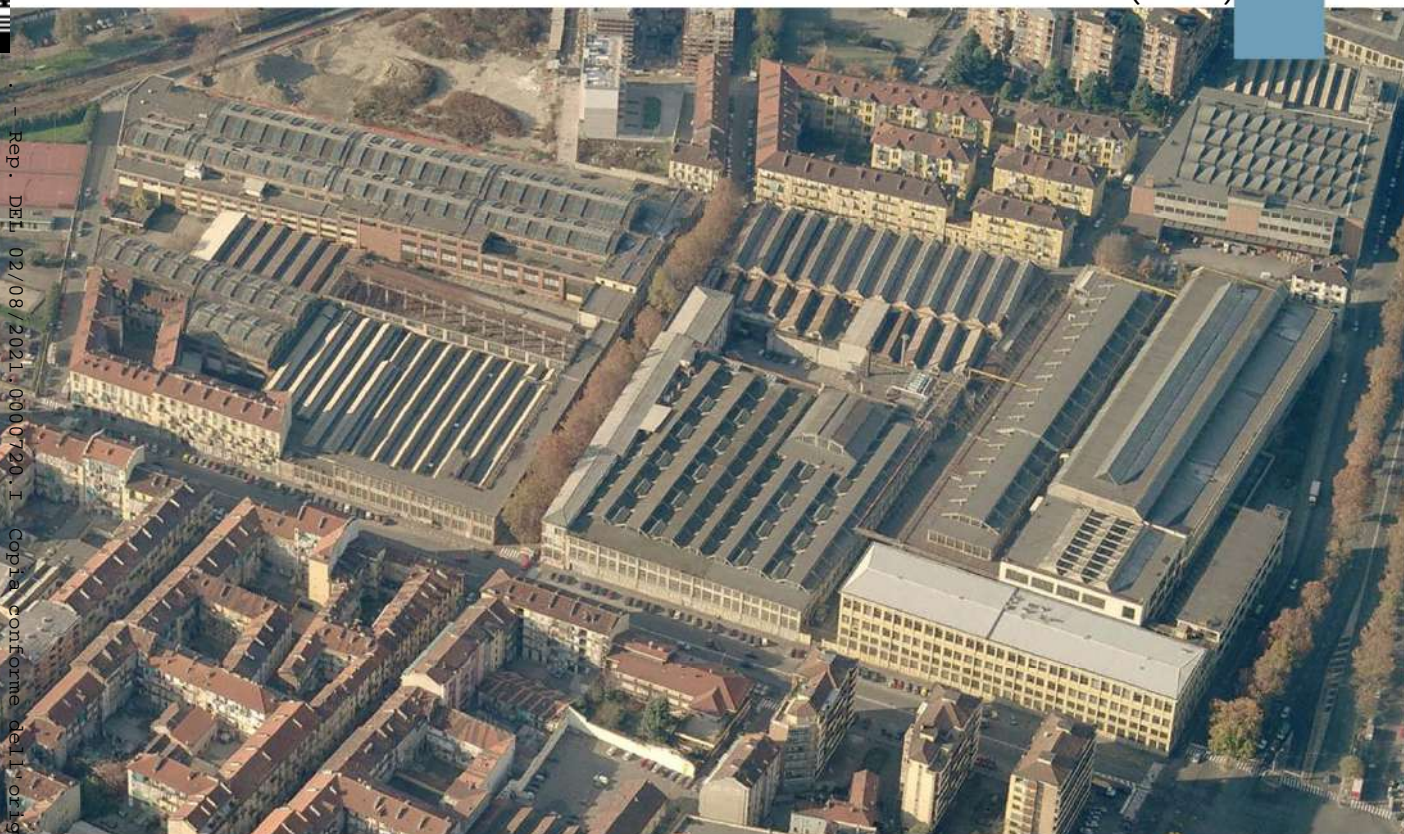
Vista aerea da est