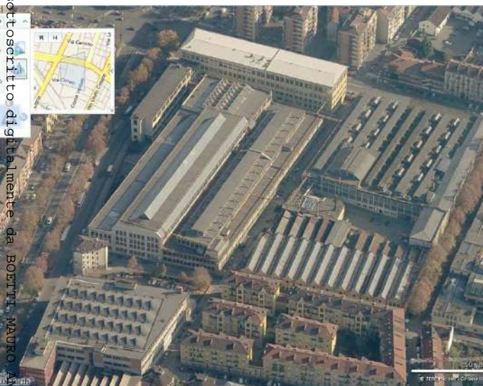
Vista aerea da ovest – area nord