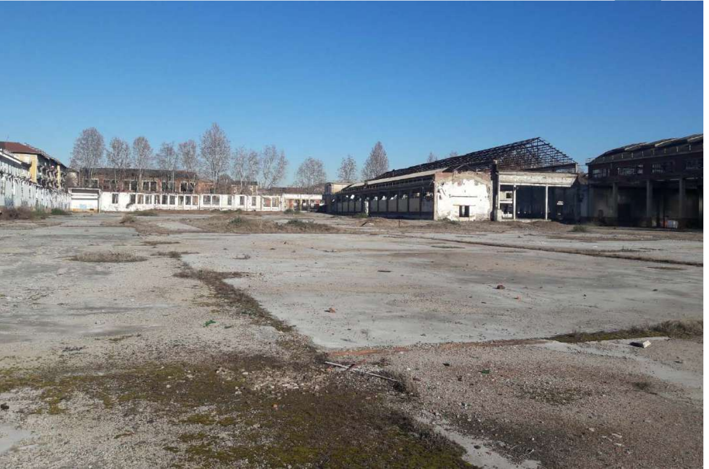
18.Vista dell'area a sud di Via Cuneo

Rep. DEL 02/08/2021.0000720.1 Copia conforme dell'originale sottoscritto digitalmente da BOETTI MAURO ANGELO Si attesta che la presente copia digitale è conforme all'originale digitale ai sensi dell'art. 23-bis del D.Lgs. n. 82/2005. Il corrispondente documento informatico originale è conservato negli archivi di Comune di Torino