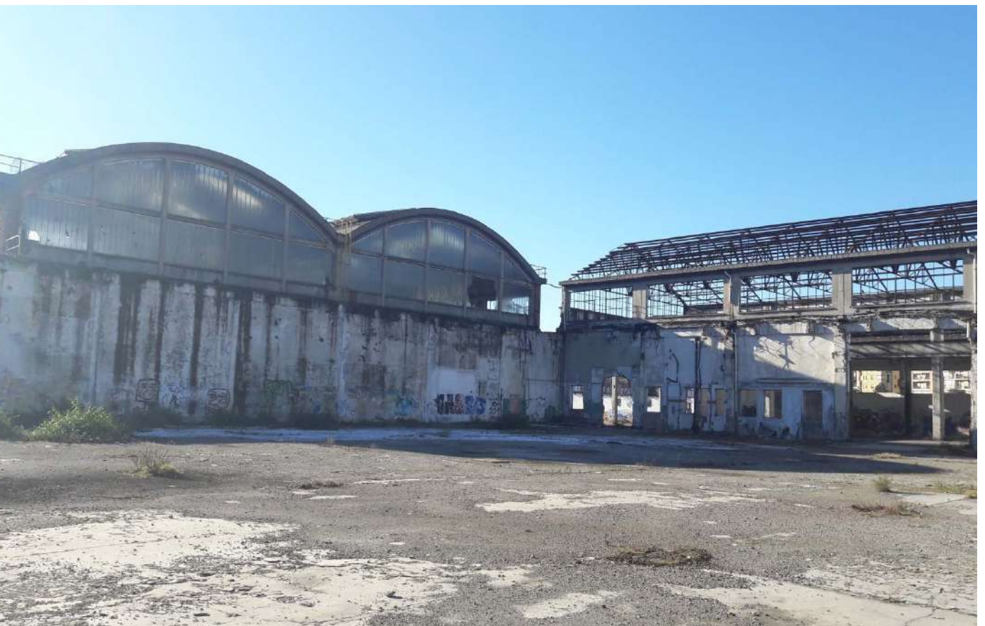
19.Fabbricati presenti nell'area sud di Via Cuneo