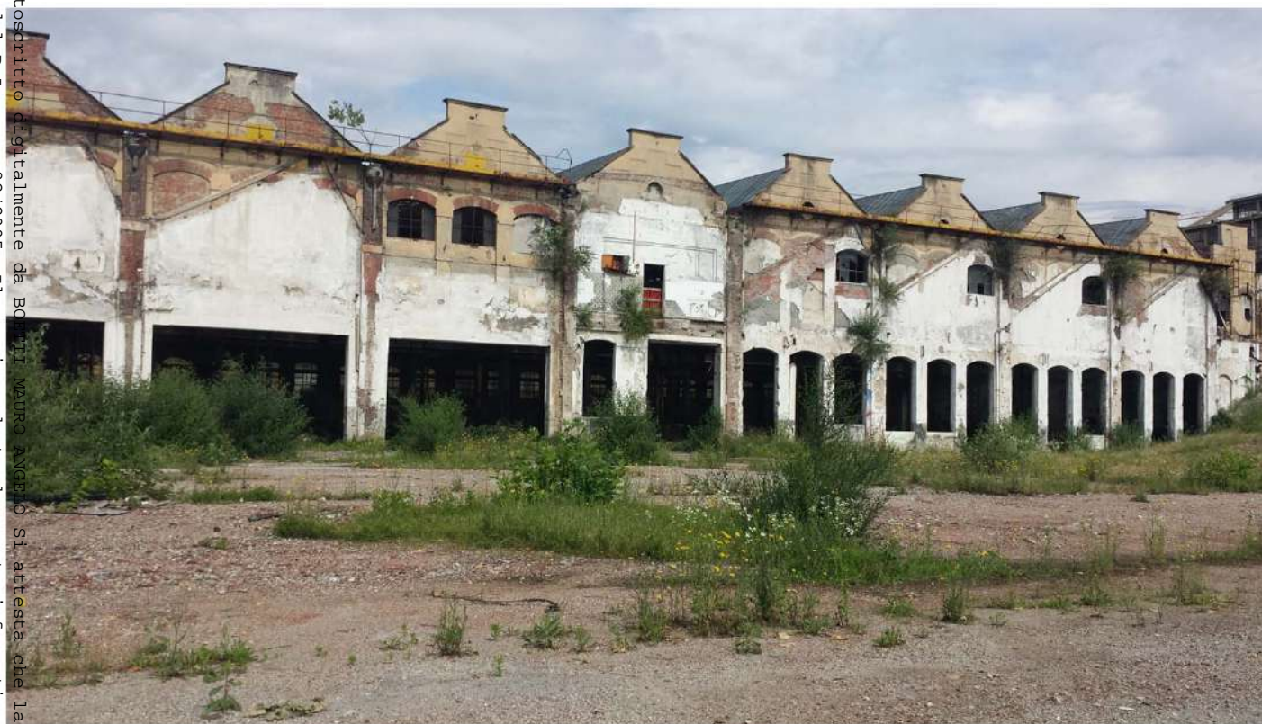
17.Edificio Fenoglio - lato est