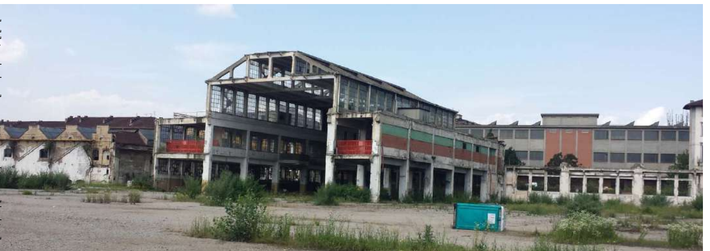
12.Vista ravvicinata dell'edificio Basilica