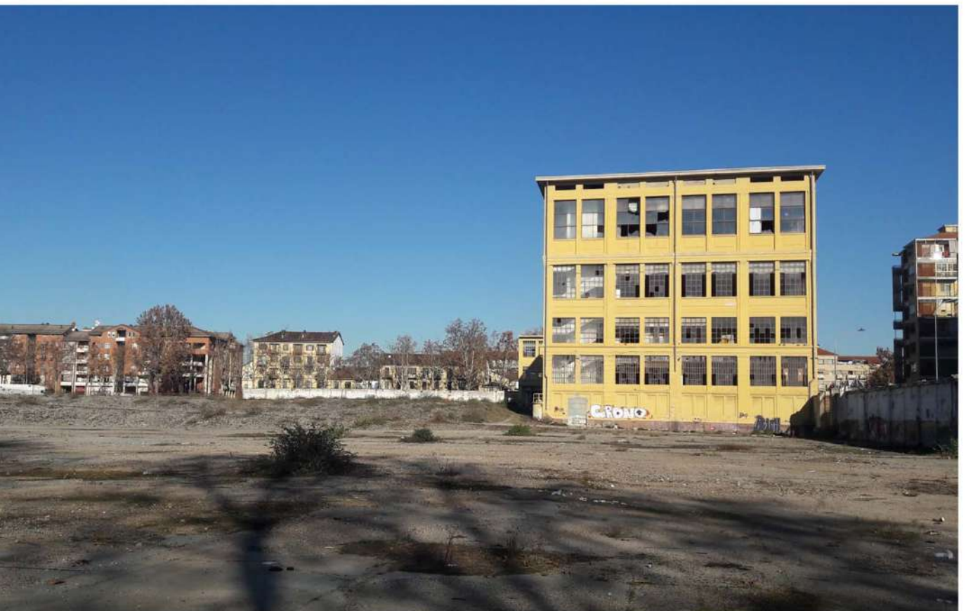
15.Lingottino - Prospetto sud