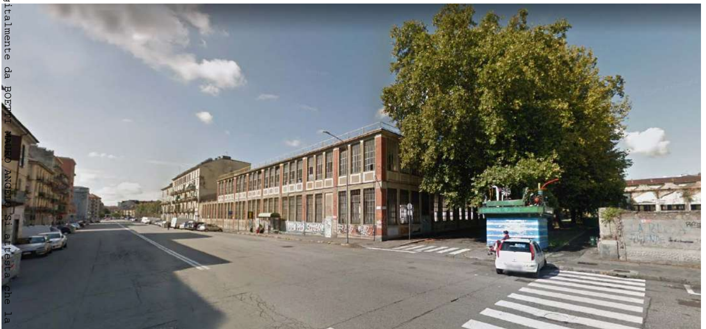
2. Corso Vercelli angolo Via Cuneo