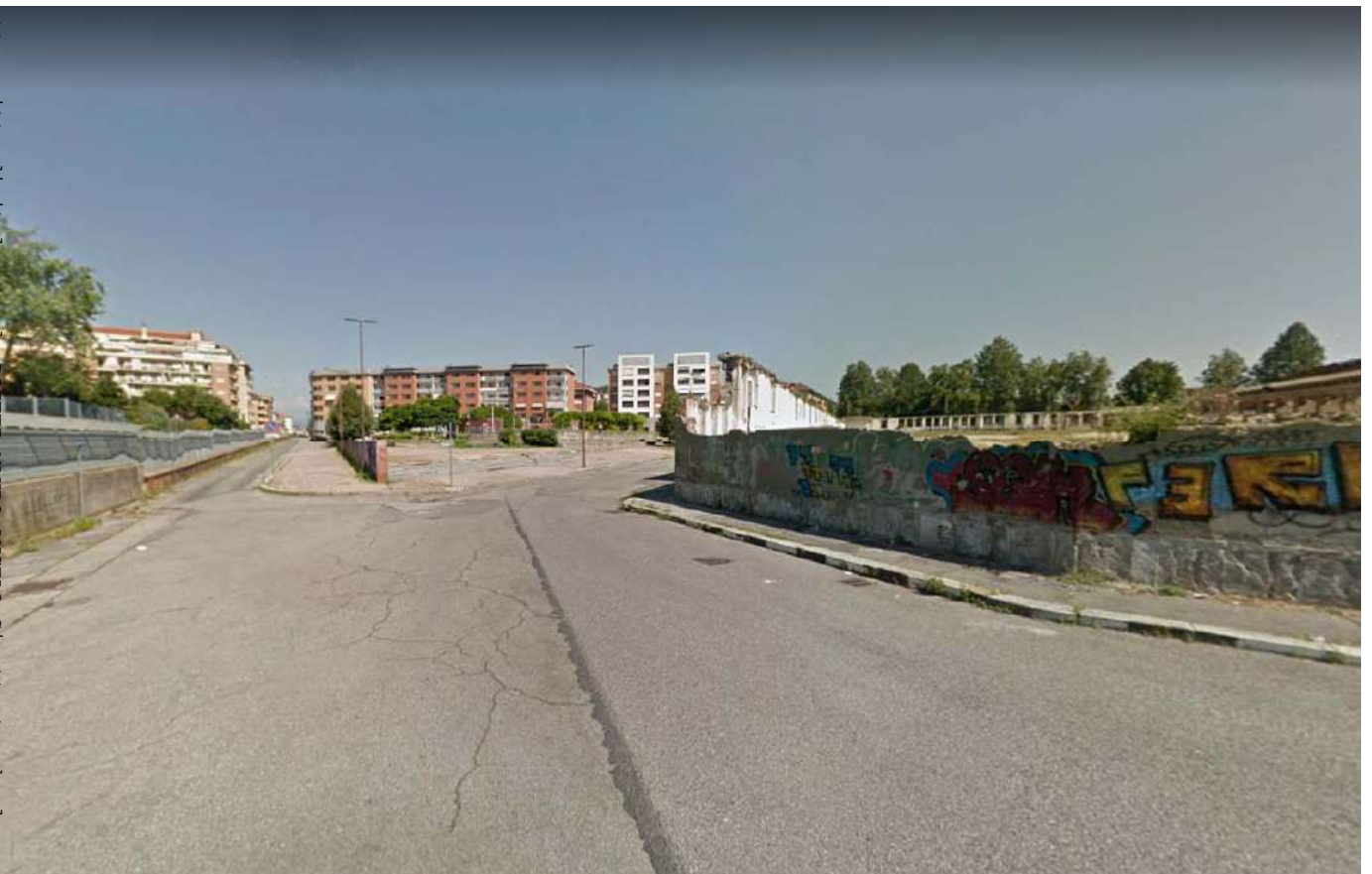
10.Via Carmagnola angolo via Damiano