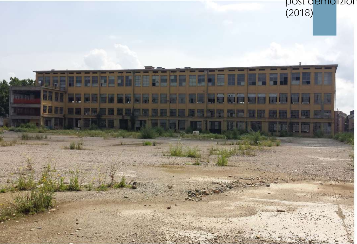
14.Lingottino - Prospetto ovest

. - Rep. Del. 02/06/2024. 0000120. I Copia conforme dell'originale sottoscritto digitalmente da BOETTI MAURO ANGELO. Si attesta che la presente copia digitale è conforme all'originale digitale ai sensi dell'art. 23-bis del D.Lgs. n. 82/2005. Il corrispondente documento informatico originale è conservato negli archivi di Comune di Torino