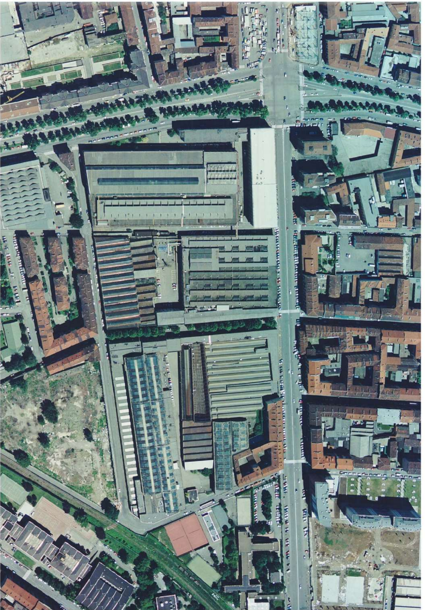
Vista aerea dell'area di intervento prima delle demolizioni (2007)

- Rep. DEL 02/08/2021.0000720.1 Copia conforme dell'originale sottoscritto digitalmente da BOETTII MAURO ANGELO Si attesta che la presente copia digitale è conforme all'originale digitale ai sensi dell'art. 23-bis del D.Lgs. n. 82/2005. Il corrispondente documento informatico originale è conservato negli archivi di Comune di Torino