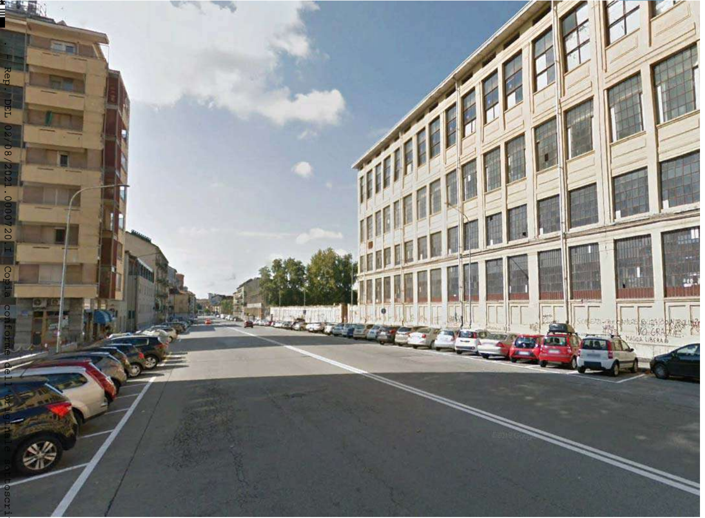
1. Corso Vercelli

Reg. DEL 02/08/2021.0000720 I Copia conforme del originale digitale è conforme all'originale digitale ai sensi dell'art. 23-bis del D.Lgs. n. 82/2005. Il corrispondente documento informatico originale è con servato negli archivi di Comune di Torino