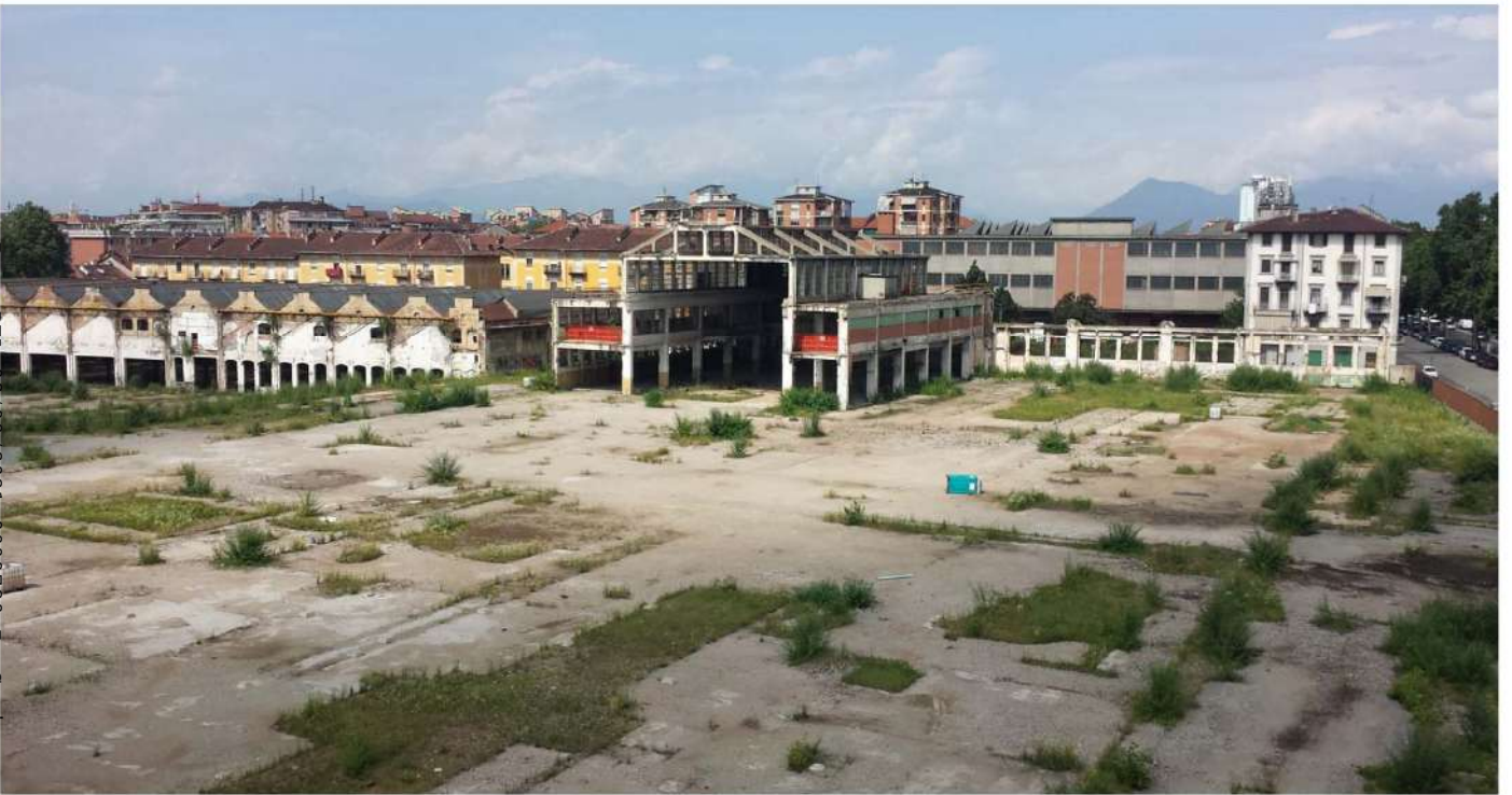
11.Veduta dell'edificio Fenoglio e edificio Basilica

Rep. DEL 02/08/2021.0000720.1 Copia conforme dell'originale sottoscritto digitalmente da BOETTI MAURO ANGELO Si attesta che la presente copia digitale è conforme all'originale digitale ai sensi dell'art. 23-bis del D.Lgs. n. 82/2005. Il corrispondente documento informatico originale è conservato negli archivi di Comune di Torino