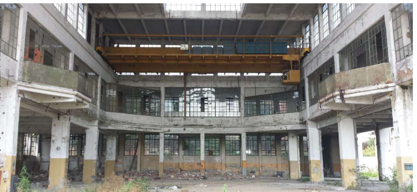
13.Vista interna edificio Basilica