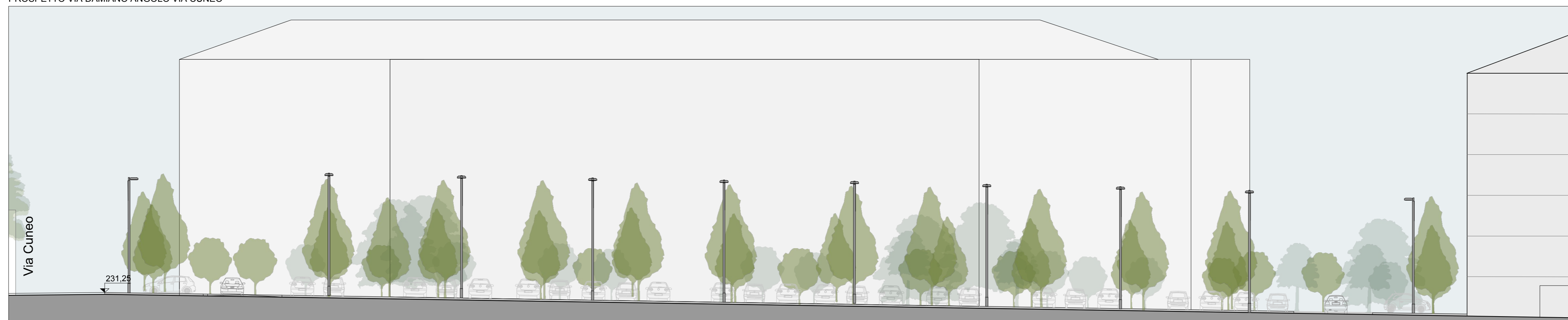
PROSPETTO VIA DAMIANO ANGOLO VIA CUNEO