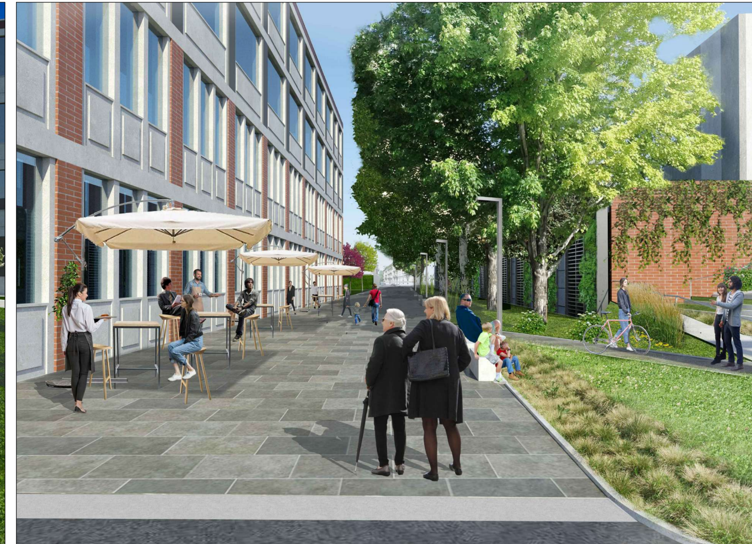
RENDER FOTOREALISTICO DELLA NUOVA VIA CUNEO PEDONALE - v089 2