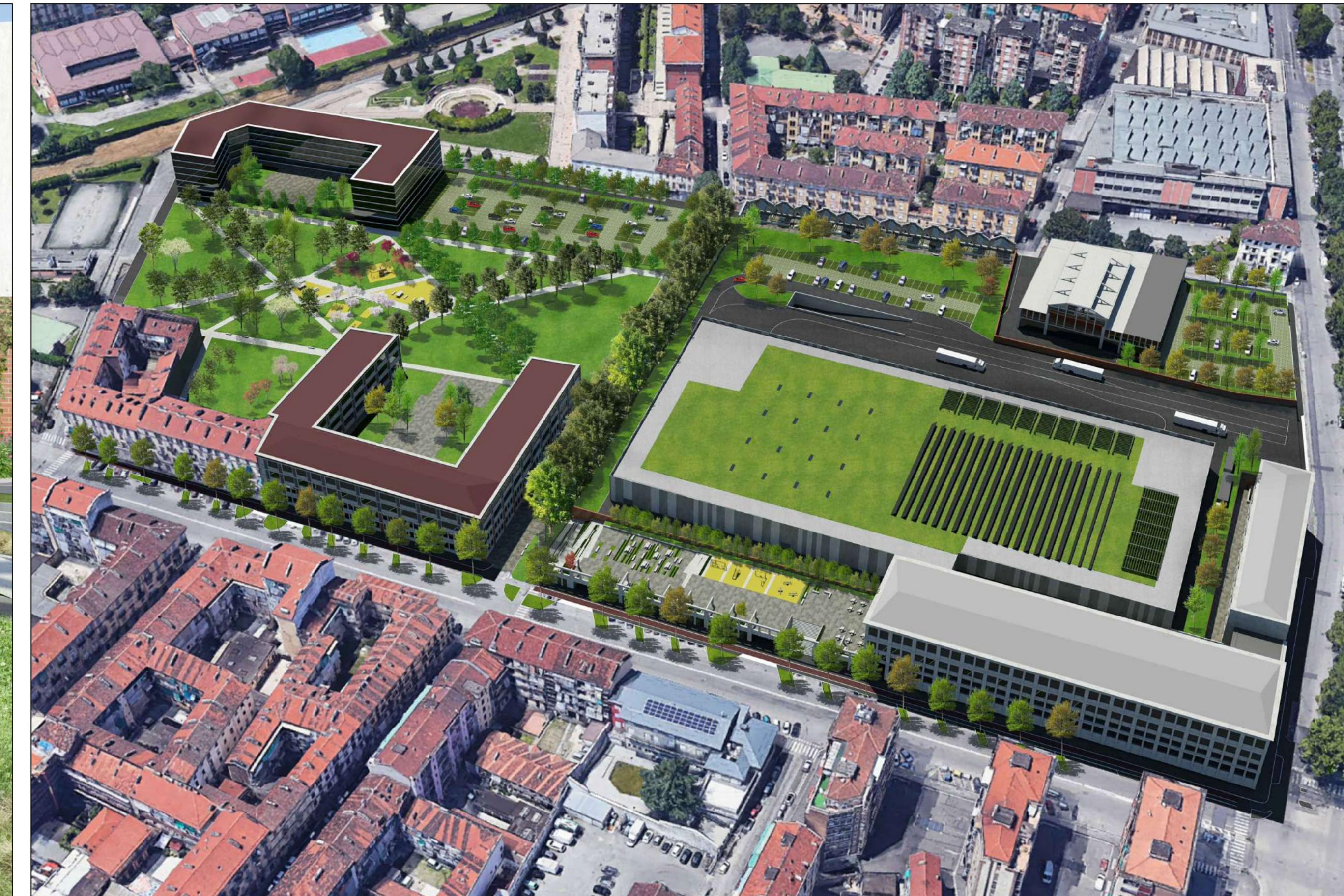
FOTOINSERIMENTO A VOLO D'UCCELLO DEL MASTERPLAN DI PROGETTO DELL'AREA DI INTERVENTO - v089 3