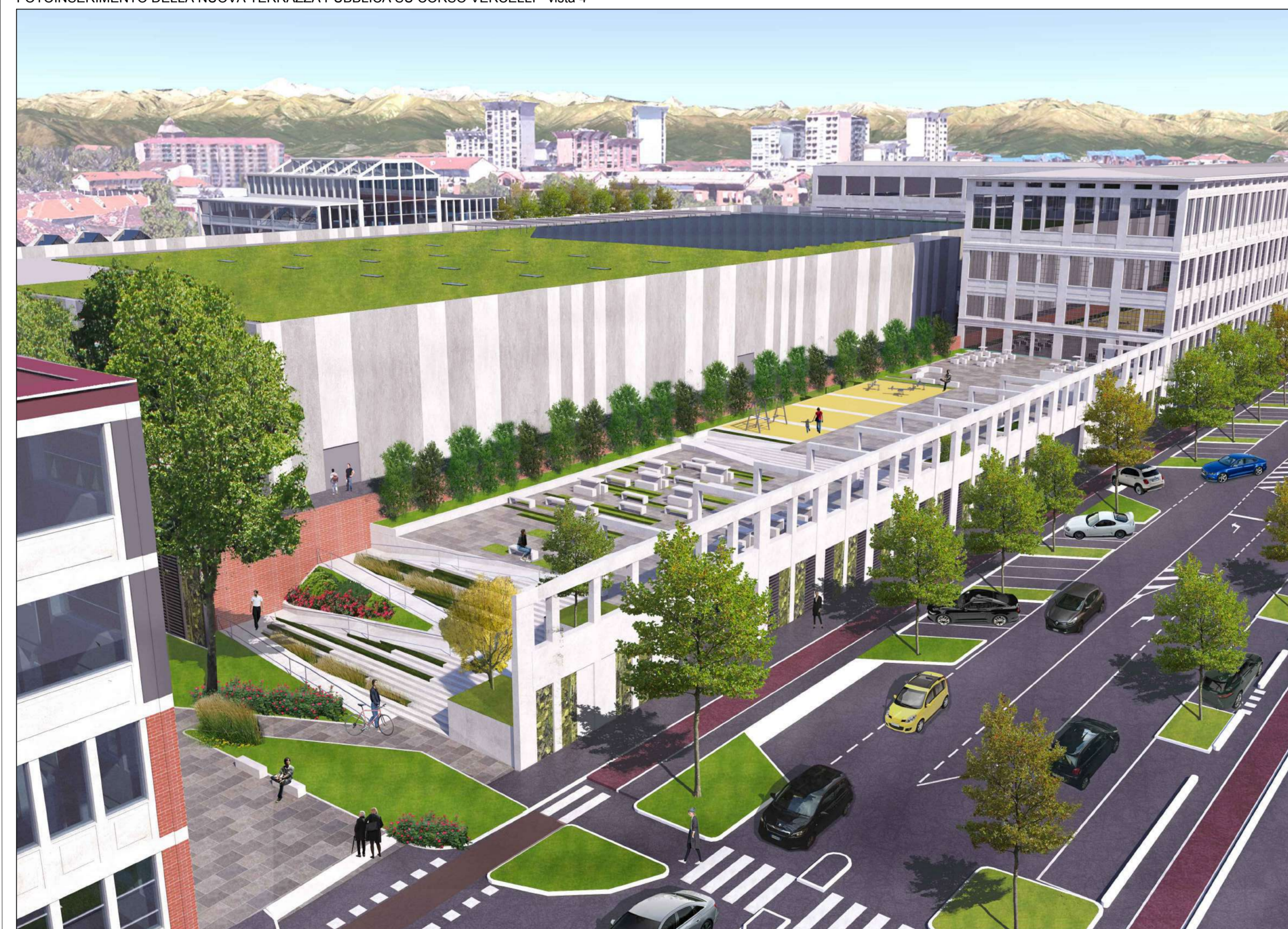
FOTOINSERIMENTO DELLA NUOVA TERRAZZA PUBBLICA SU CORSO VERCELLI - v089 4