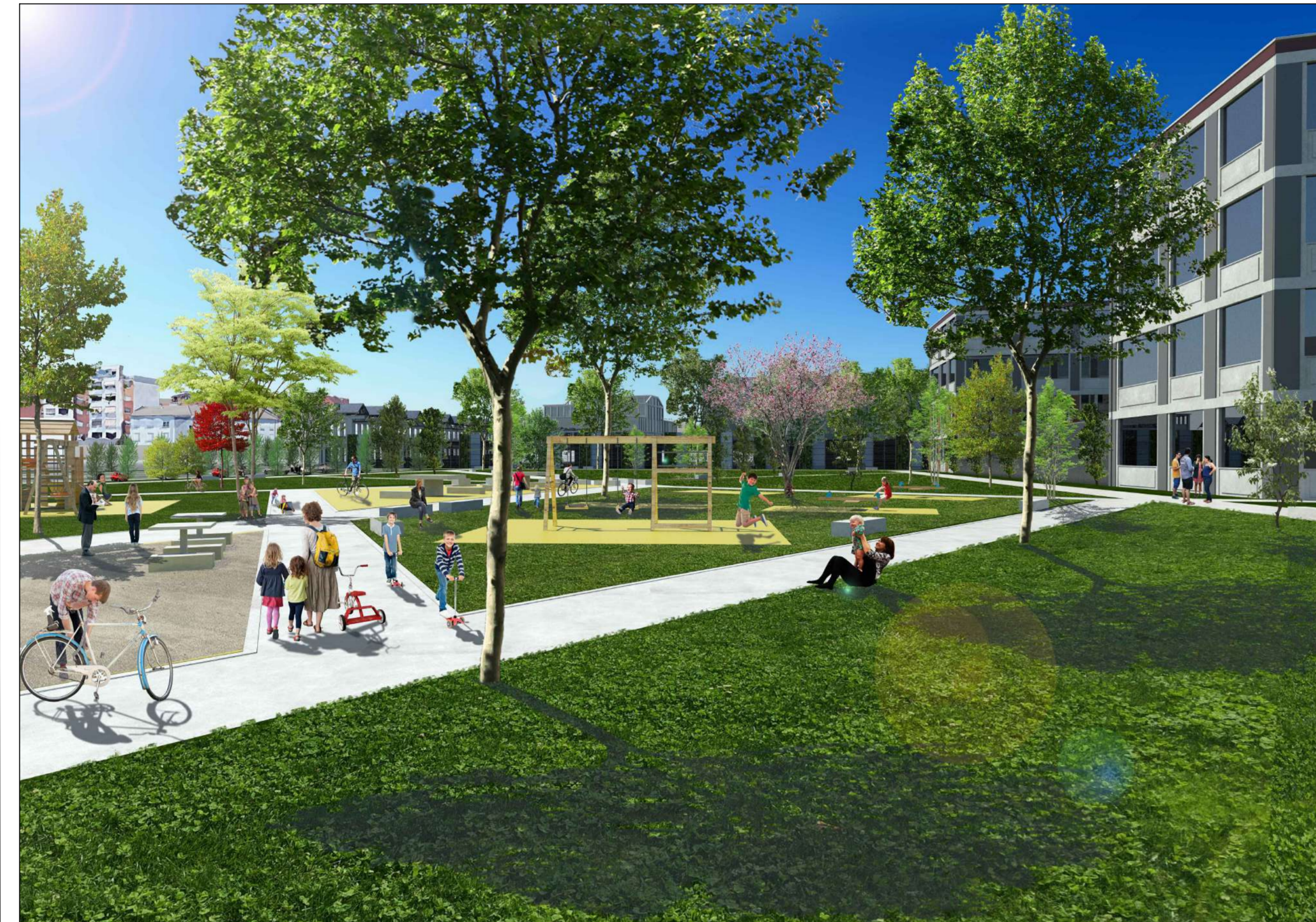
RENDER FOTOREALISTICO DEL PARCO PUBBLICO IN PROGETTO - v089 1