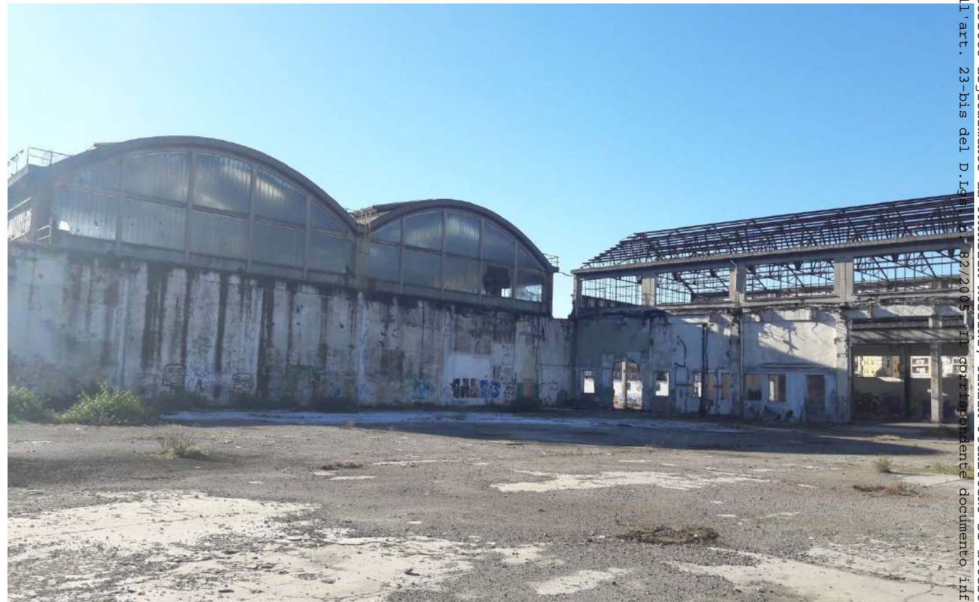
19.Fabbricati presenti nell'area sud di Via Cuneo

- Rep. DEL 23/01/2023, 0000013. I Copia conforme dell'originale sottoscritto digitalmente da PATRIZIA ROSSINI, TERESA POCHETTINO si attesta che la presente copia digitale è conforme all'originale digitale ai sensi dell'art. 23-bis del D.lgs n. 82/2005. Il corrispondente documento informatico originale è conservato negli archivi di Comune di Torino