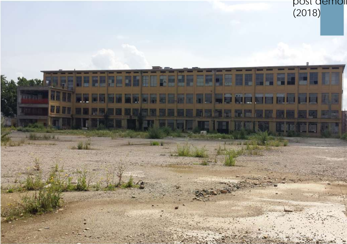
14.Lingottino - Prospetto ovest