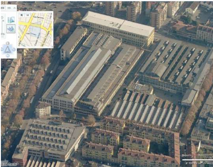
Vista aerea da ovest - area nord