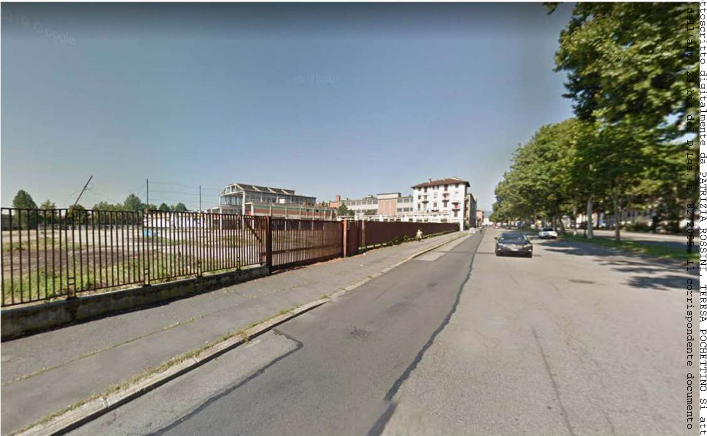
4. Corso Vigevano

- Rep. DEL 23/01/2023, 0000013, I. Copia conforme dell'originale sottoscritto digitalmente da PATRIZIA ROSSINI, TERESA POCHETTINO. Si attesta che la presente copia digitale è conforme all'originale digitale ai sensi dell'art. 23-bis del D Lgs. n. 82/2005. Il corrispondente documento informatico originale è conservato negli archivi di Comune di Torino