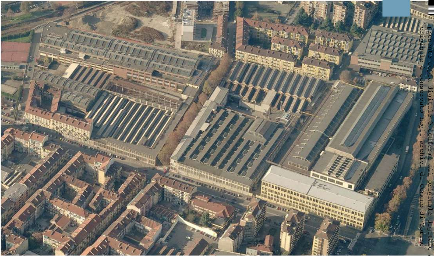
Vista aerea da est