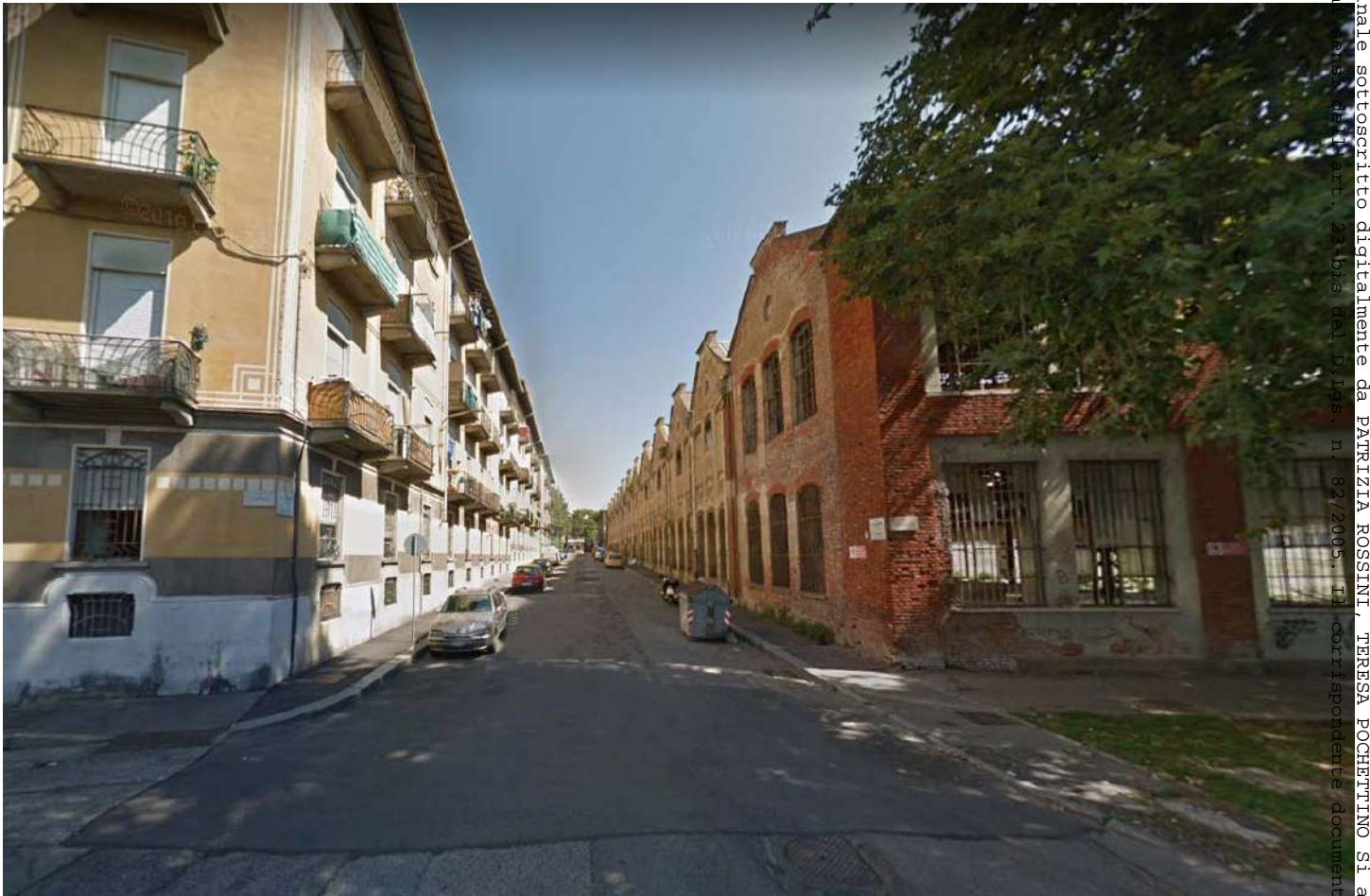
6.Via Damiano angolo Via Cune

- Rep. DEL. 23/01/2023, 0000013, I. Copia conforme dell'originale sottoscritto digitalmente da PATRIZIA ROSSINI, TERESA POCHETTINO si attesta che la presente copia digitale è conforme all'originale digitale a sensi dell'art. 21 bis del D.Lgs. n. 82/2005. Il corrispondente documento informatico originale è conservato negli archivi di Comune di Gorino