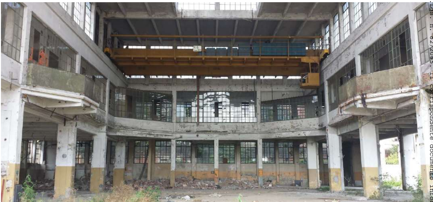
13.Vista interna edificio Basilica

- Rep. DEL. 23/01/2023, 0000013, I. Copia conforme dell'originale sottoscritto digitalmente da PATRIZIA ROSSINI, TERESA POCHETTINO. Si attesta che la presente copia digitale è conforme all'originale digitale ai sensi dell'art. 23-bis del D.D.Lgs. n. 82/2005. Il corrispondente documento informatico originale è conservato negli archivi di Comune di Torino