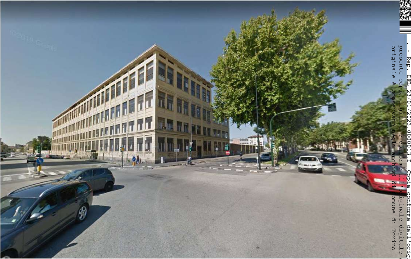
3. Corso Vigevano angolo corso Verce