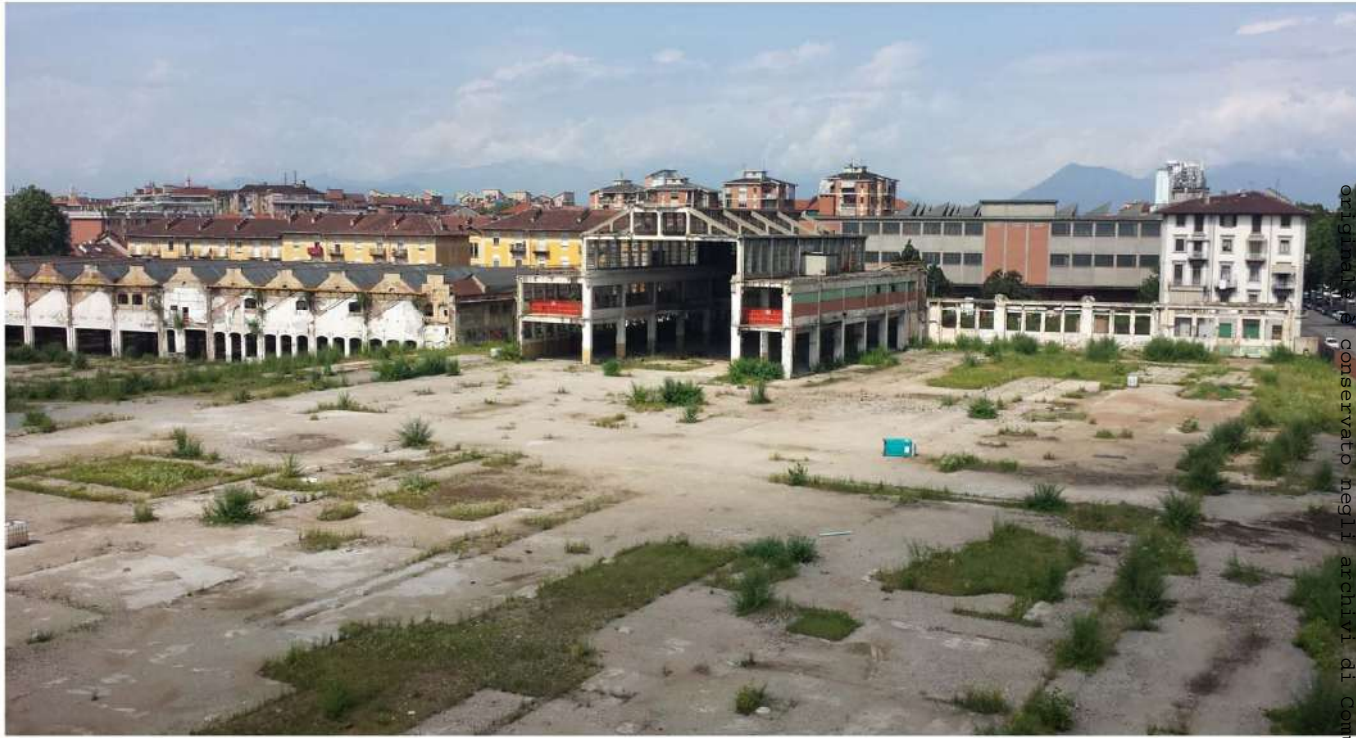
11.Veduta dell'edificio Fenoglio e edificio Basilica