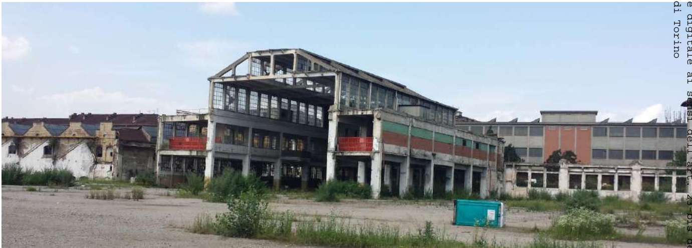
12.Vista ravvicinata dell'edificio Basilica