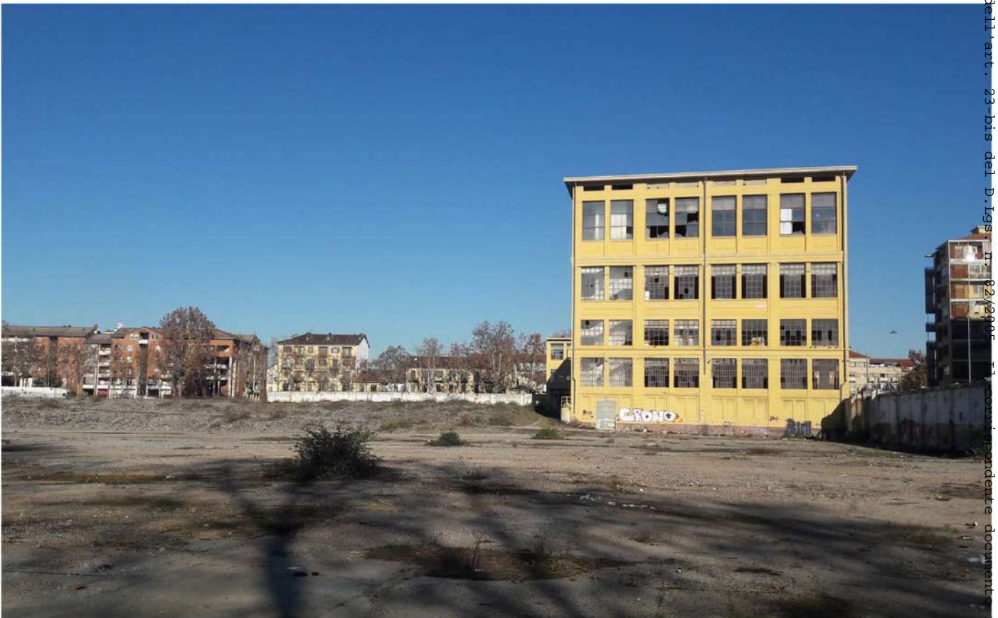
15.Lingottino - Prospetto sud

- Rep. DEL 23/01/2023.0000013. I Copia conforme dell'originale sottoscritto digitalmente da PATRIZIA ROSSINI, TERESA POCHETTINO si attesta che la presente copia digitale è conforme all'originale digitale ai sensi dell'art. 23-bis del D.Lgs. n. 82/2005. Il corrispondente documento informatico originale è conservato negli archivi di Comune di Torino