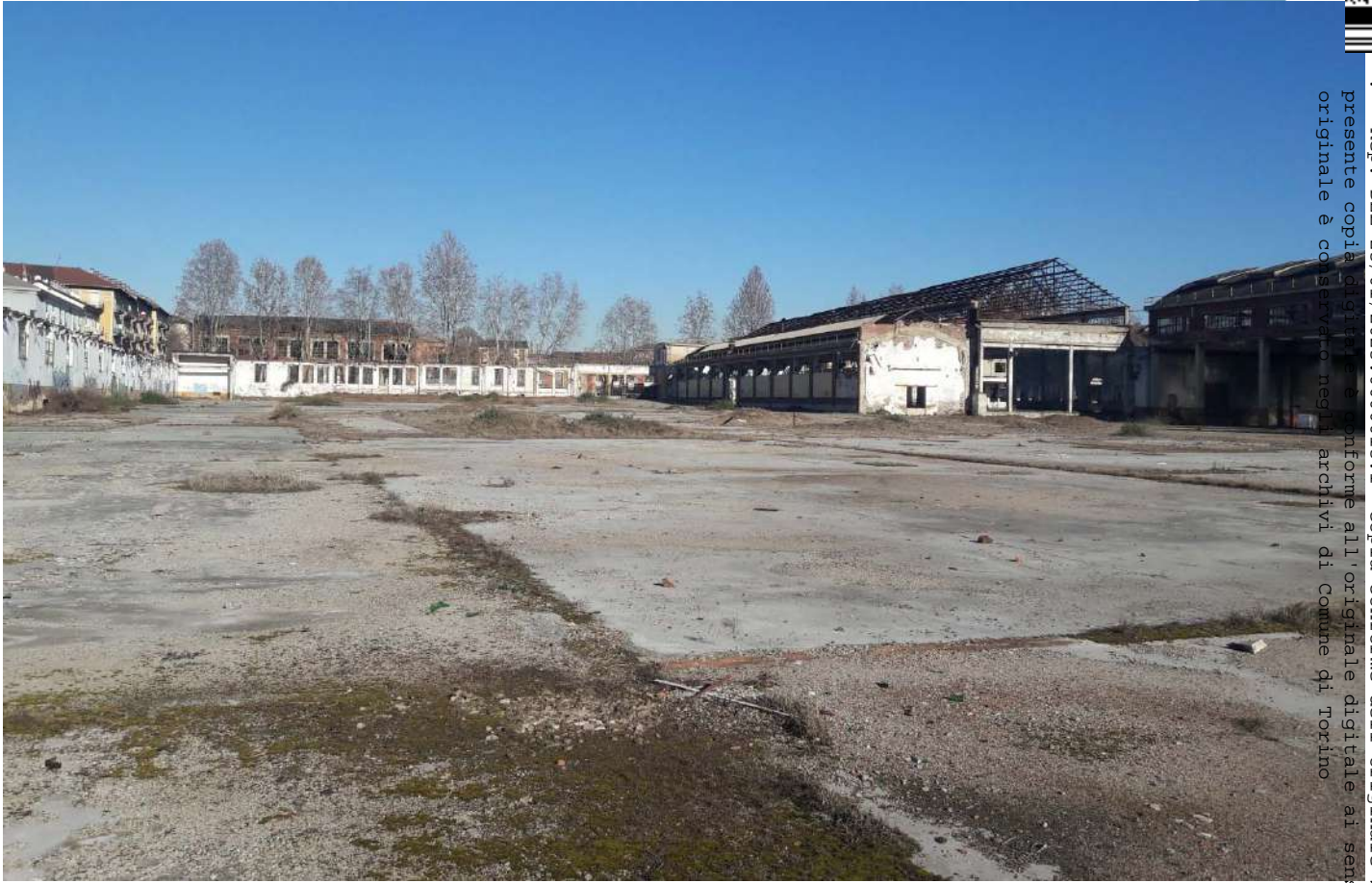
18.Vista dell'area a sud di Via Cuneo