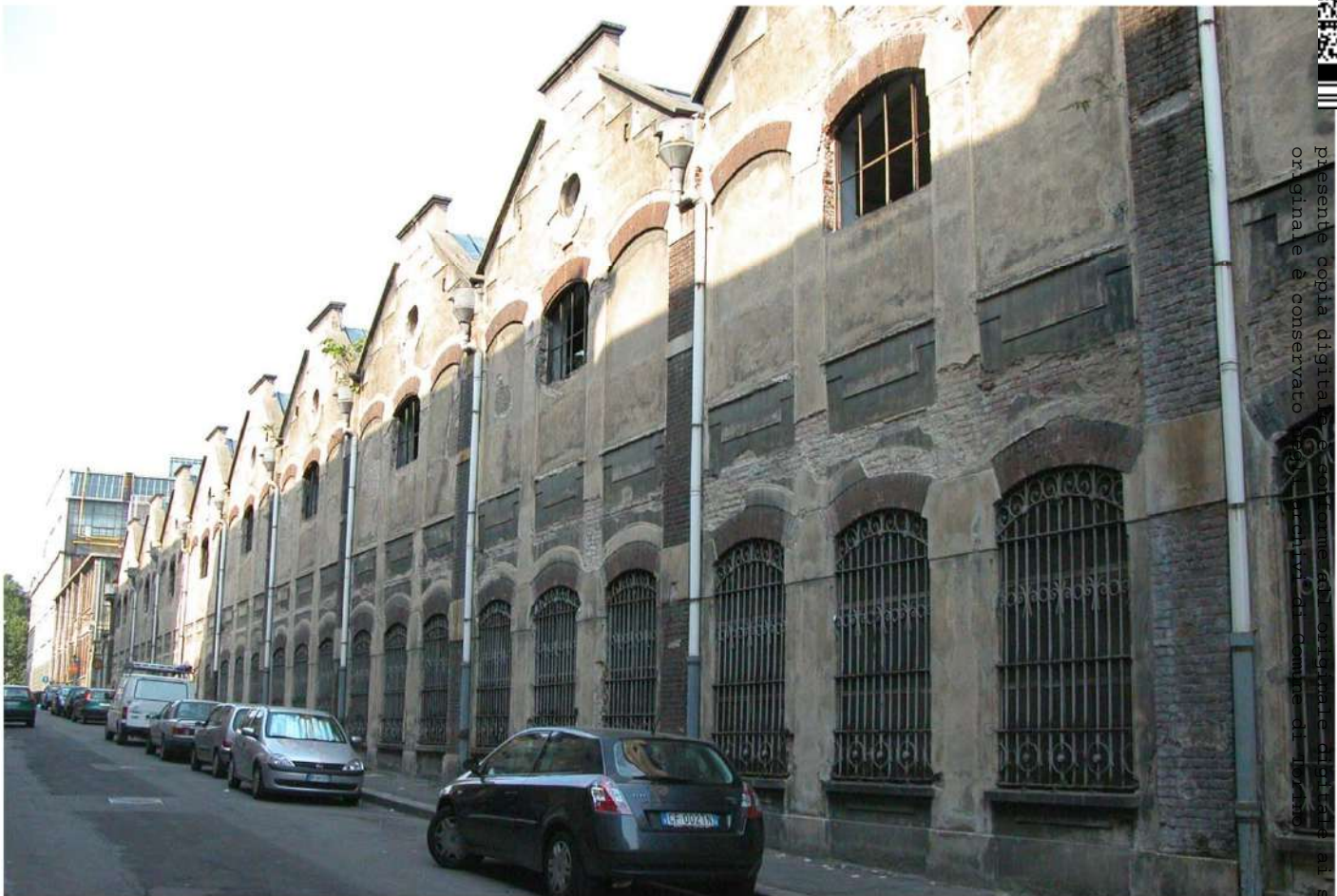
16. Edificio Fenoglio - Via Damiano

Arrivo: AOO 055, N. Prot. 00001955 del 15/06/2021