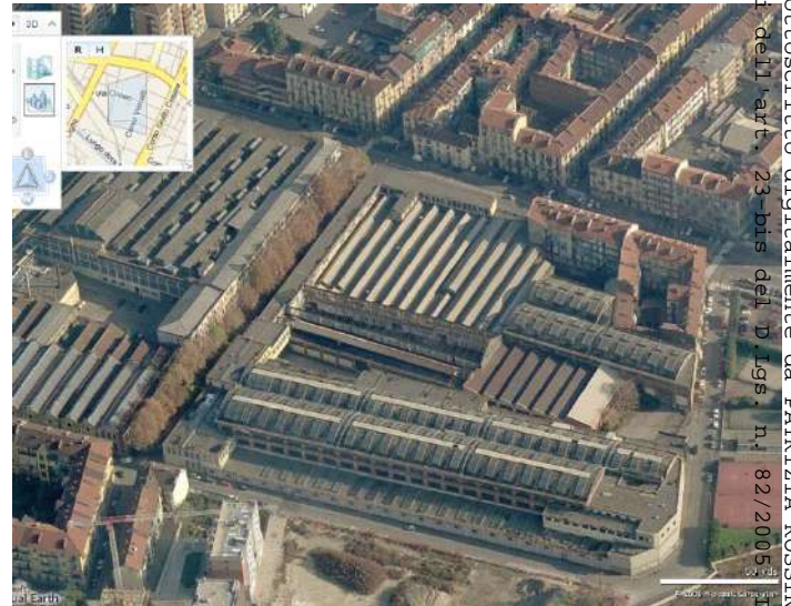
Vista aerea da ovest - area sud

Arrivo: AOO 055, N. Prot. 00001955 del 15/06/2021