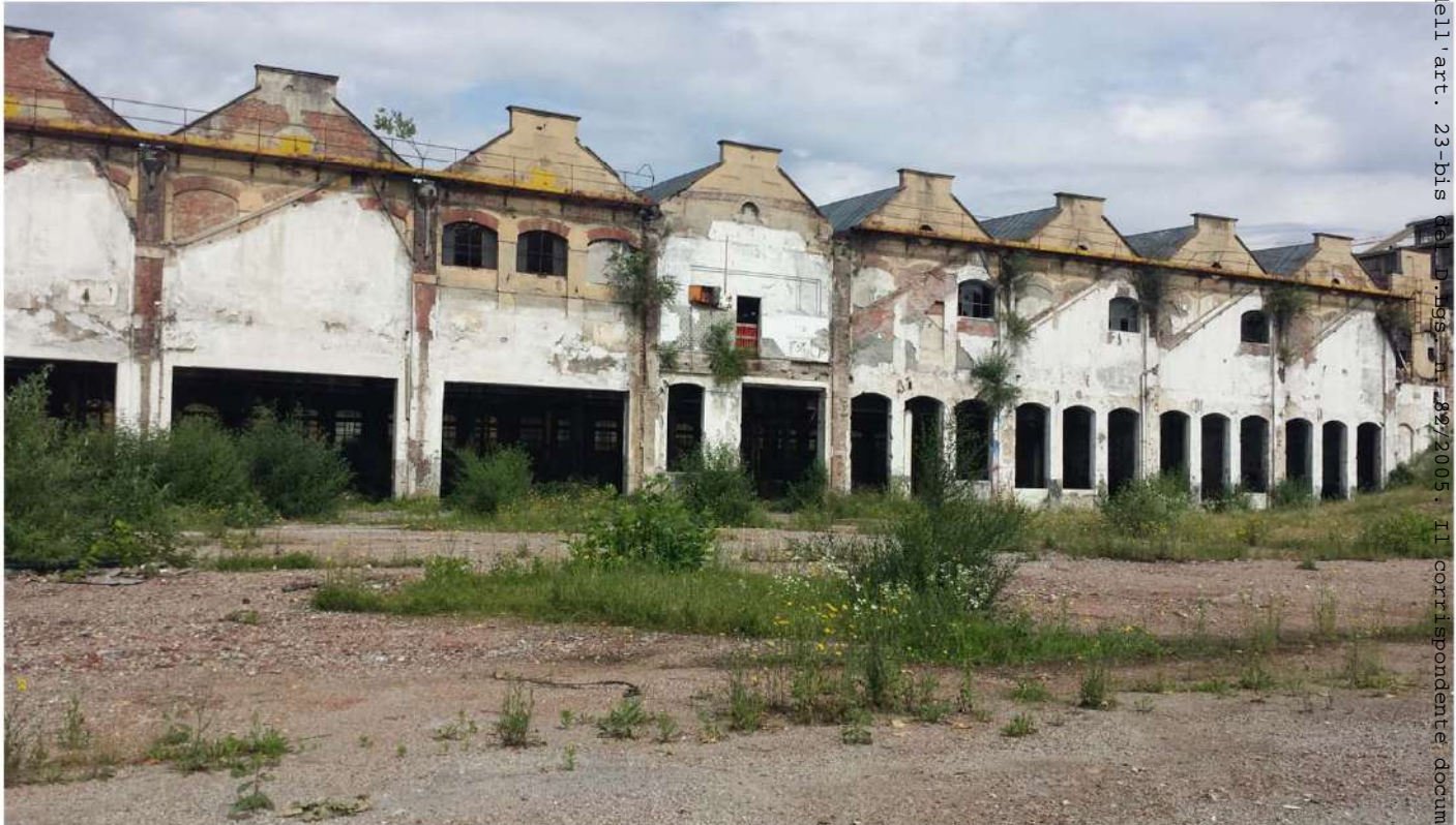
17. Edificio Fenoglio - lato est