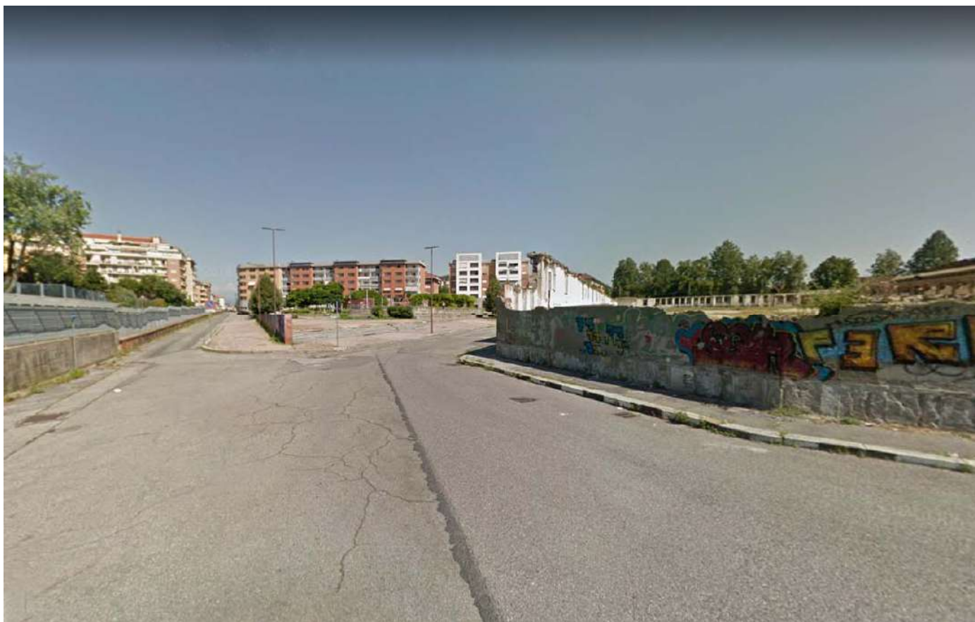
10.Via Carmagnola angolo via Damiano

Arrivo: AOO 055, N. Prot. 00001955 del 15/06/2021