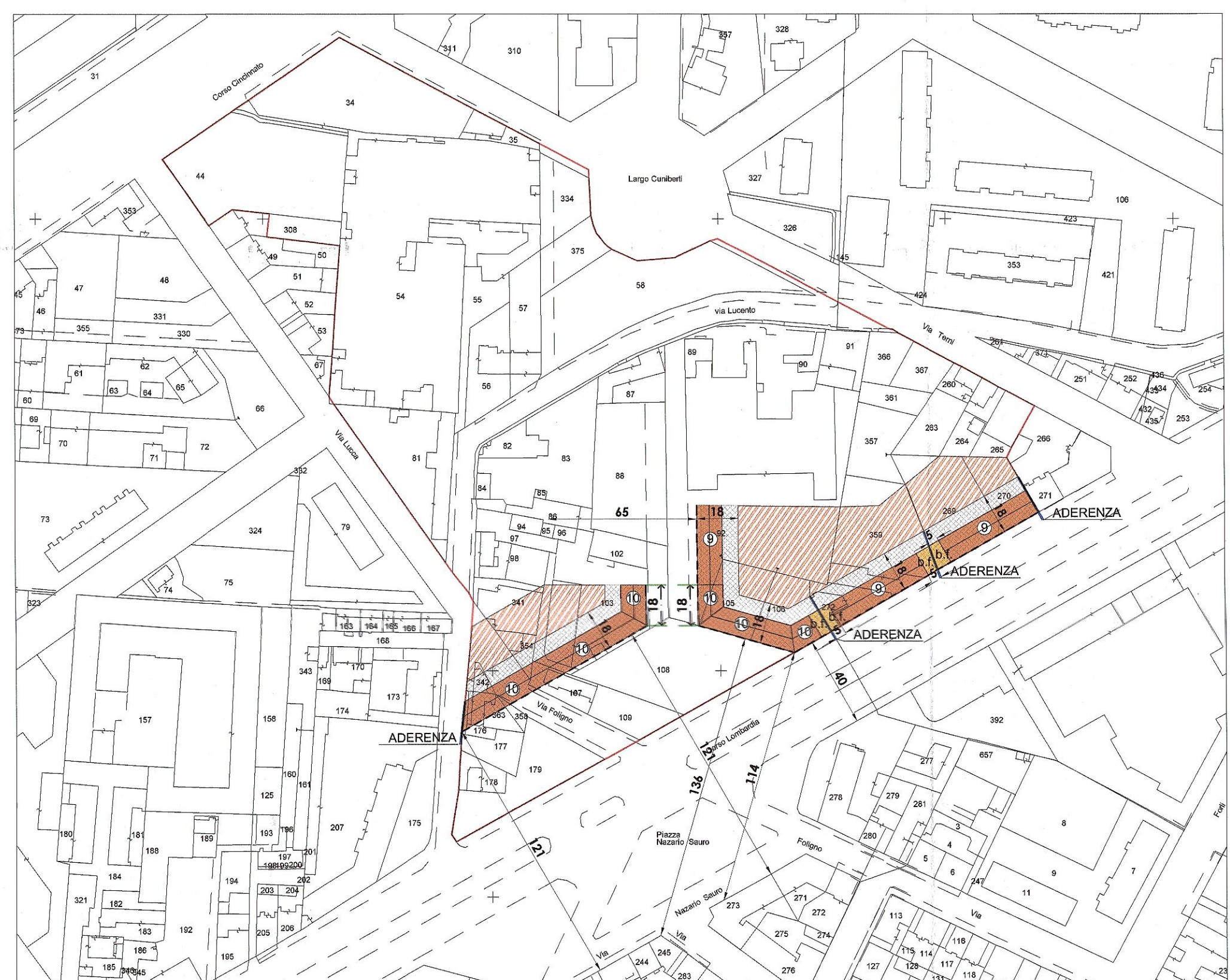
REGOLE EDILIZIE SOLUZIONE B SCALA 1:2000