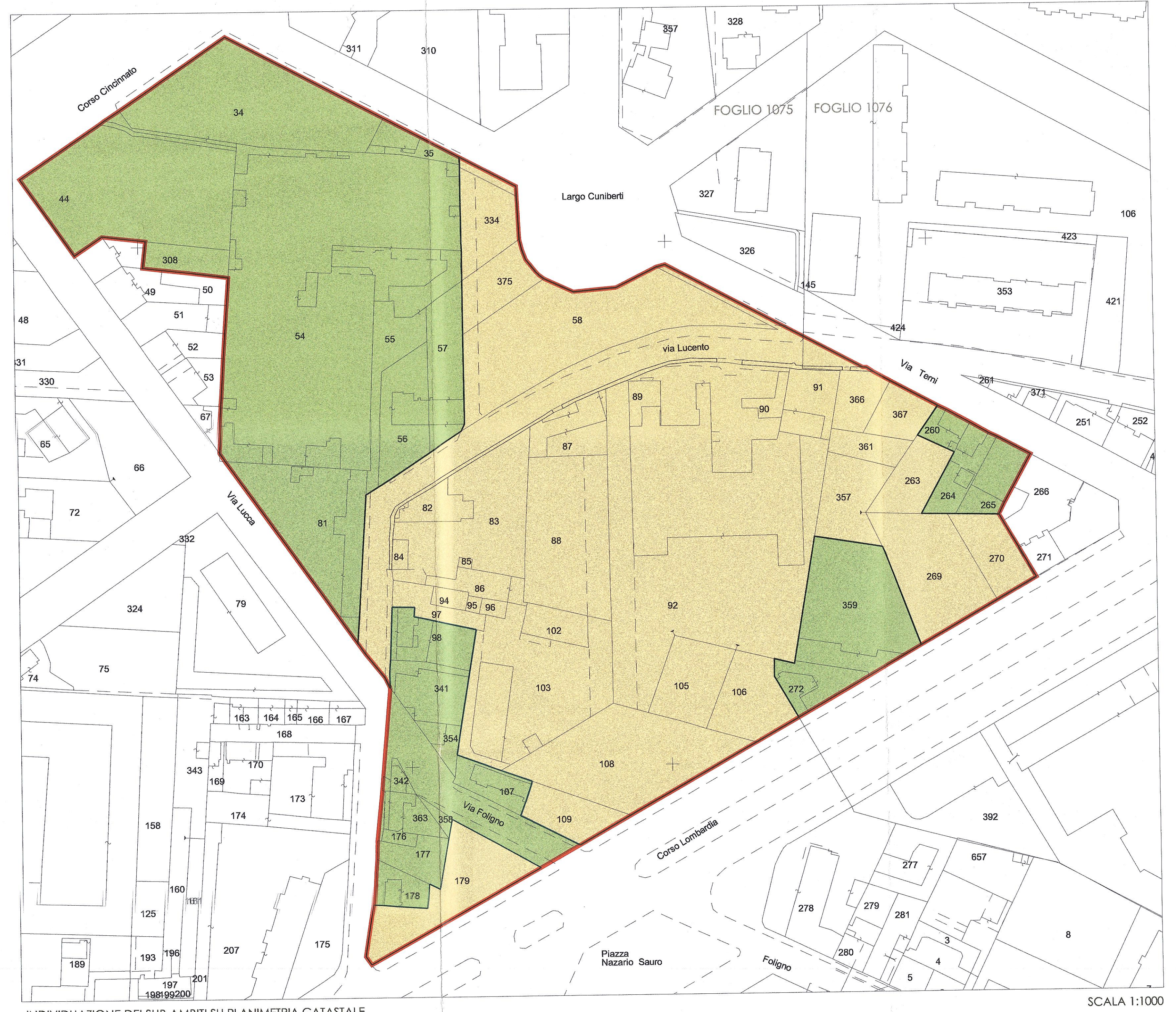
INDIVIDUAZIONE DEI SUB AMBITI SU PLANIMETRIA CATASTALE AMBITO 4d mq 59.743 SUB AMBITO A SUP. TERRITORIALE mq. 34.356 SUB AMBITO B SUP. TERRITORIALE mq. 25.387 SCALA 1:1000