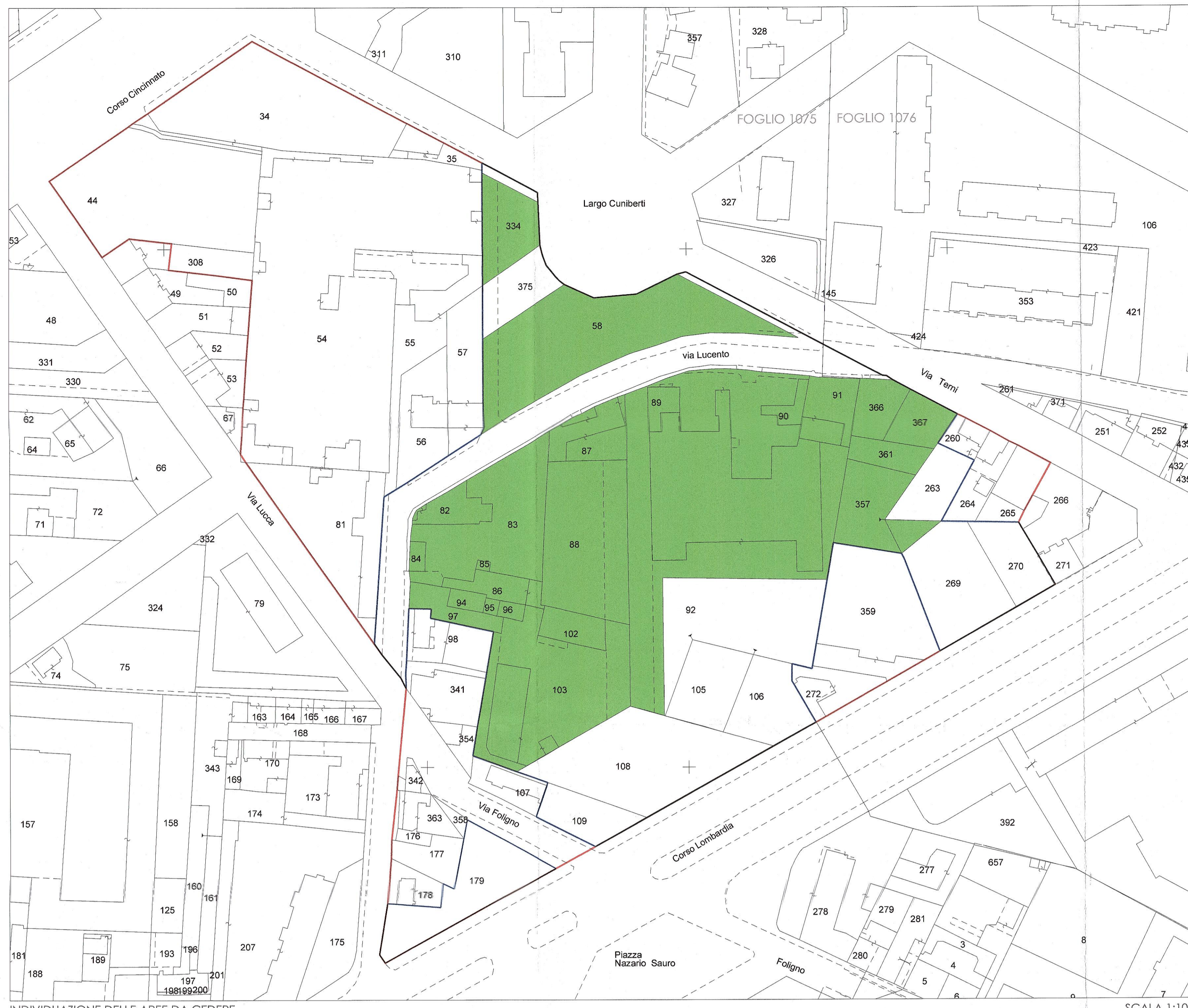
INDIVIDUAZIONE DELLE AREE DA CEDERE