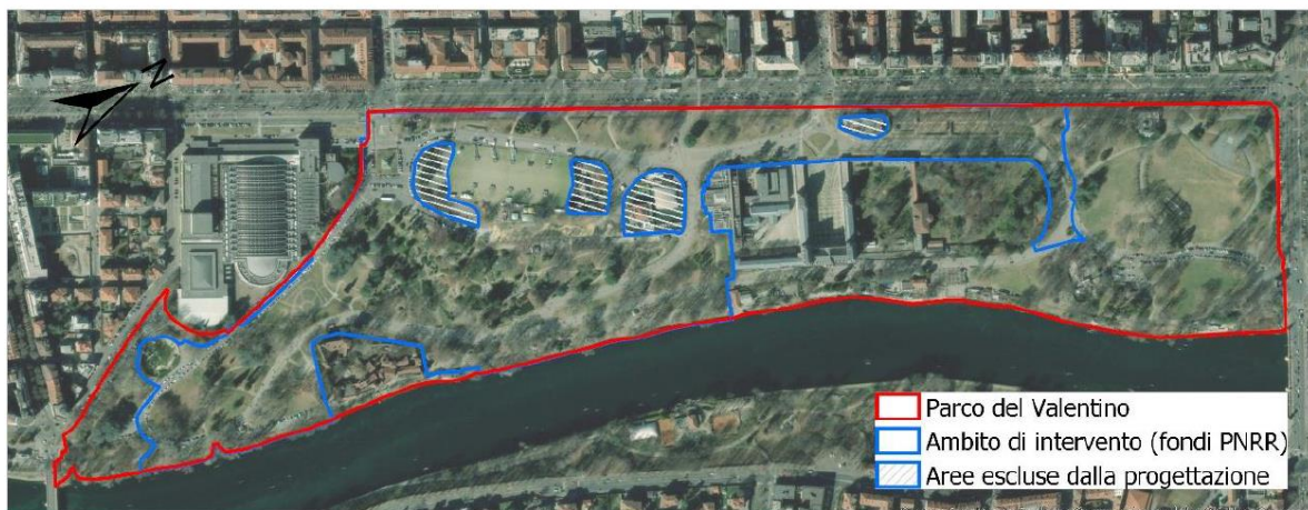
Figura 3-1: Localizzazione area di intervento

Facendo seguito alla Conferenza di Servizi di cui all'oggetto, tenutasi in data 16 maggio 2023 (nota di convocazione pervenuta alla Divisione scrivente in data 28 aprile 2023, prot. arr. n. 1238), presa visione del progetto di fattibilità tecnica ed economica per la riqualificazione e recupero delle aree verdi del Parco del Valentino, illustrato in tale sede, si riferisce per competenza quanto segue.