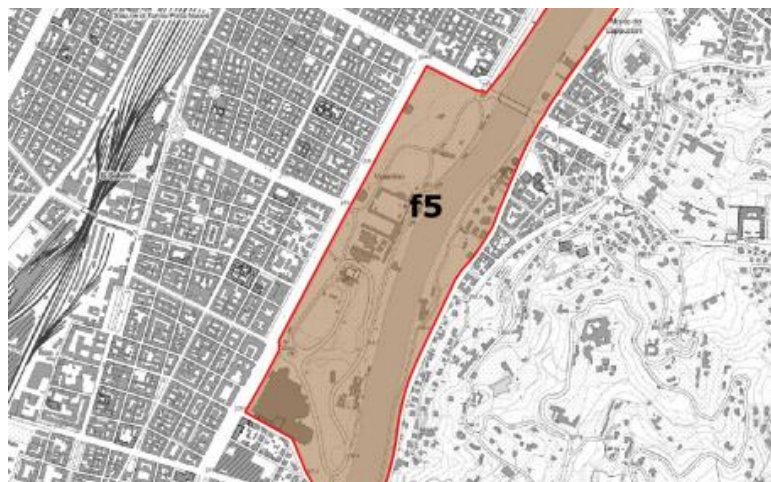
Zone Naturali di Salvaguardia e Aree contigue

Ciò premesso, si fa presente, a titolo collaborativo, che la relazione urbanistica allegata alla documentazione progettuale presentata, potrebbe essere integrata, per quanto riguarda la Pianificazione sovraordinata, con la cartografia e le eventuali disposizioni relative alle Aree contigue di cui alla L.R.19/2009, in quanto il Parco del Valentino ricade all'interno dell'Area contigua f5; sarebbe, inoltre, opportuna la verifica dei contenuti del Piano Territoriale Generale Metropolitano (PTGM), adottato dalla Città Metropolitana con deliberazione del Consiglio metropolitano n.66 del 22.12.2022.