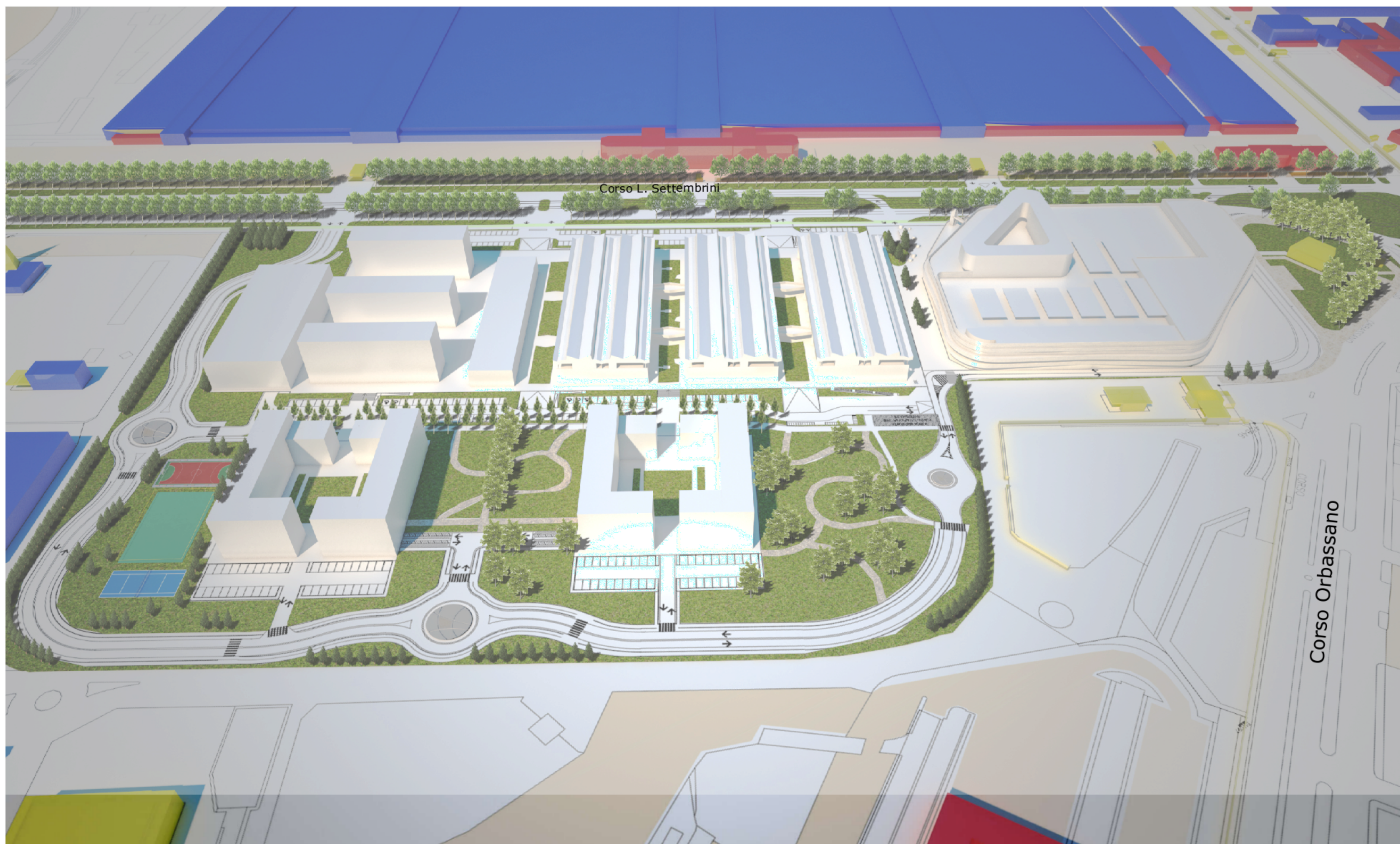
Planivolumetrico - Vista Nord-Ovest