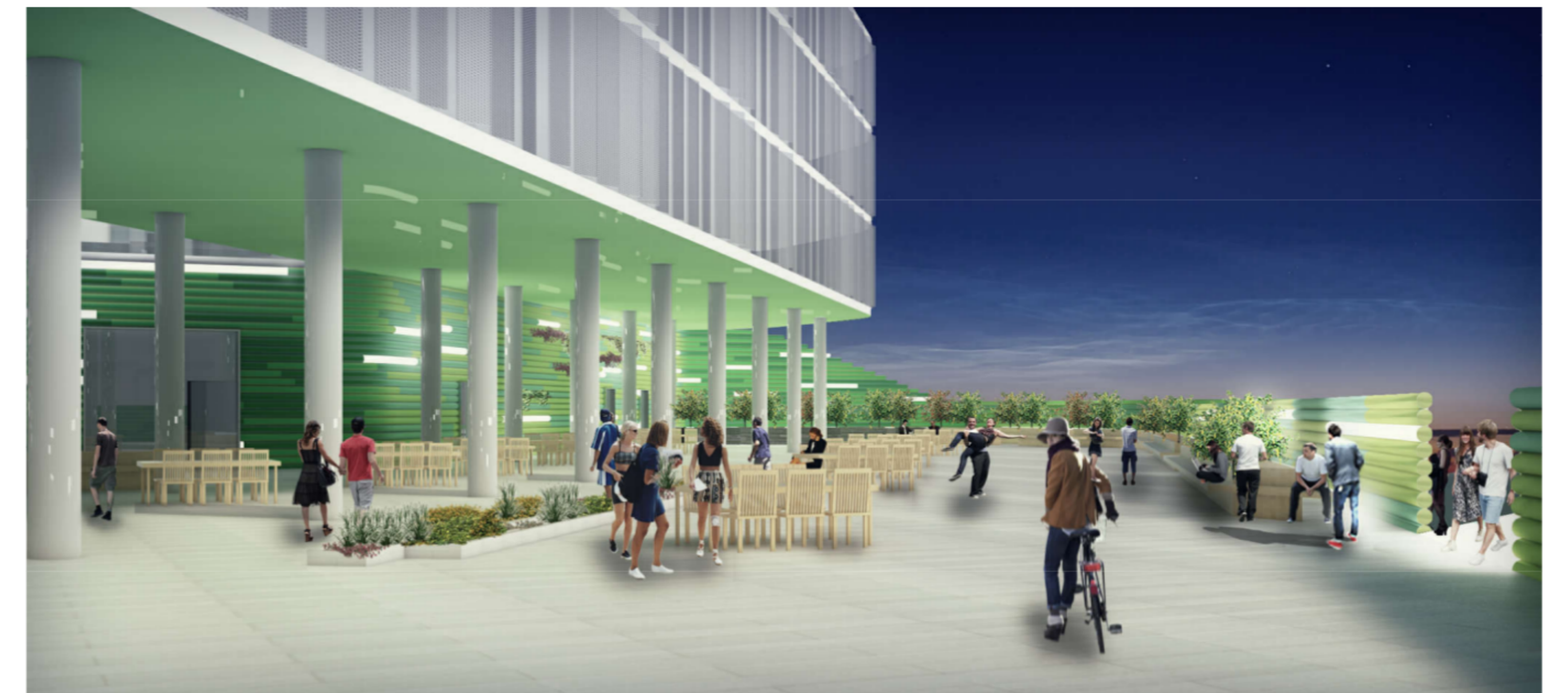
Vista terrazza secondo piano