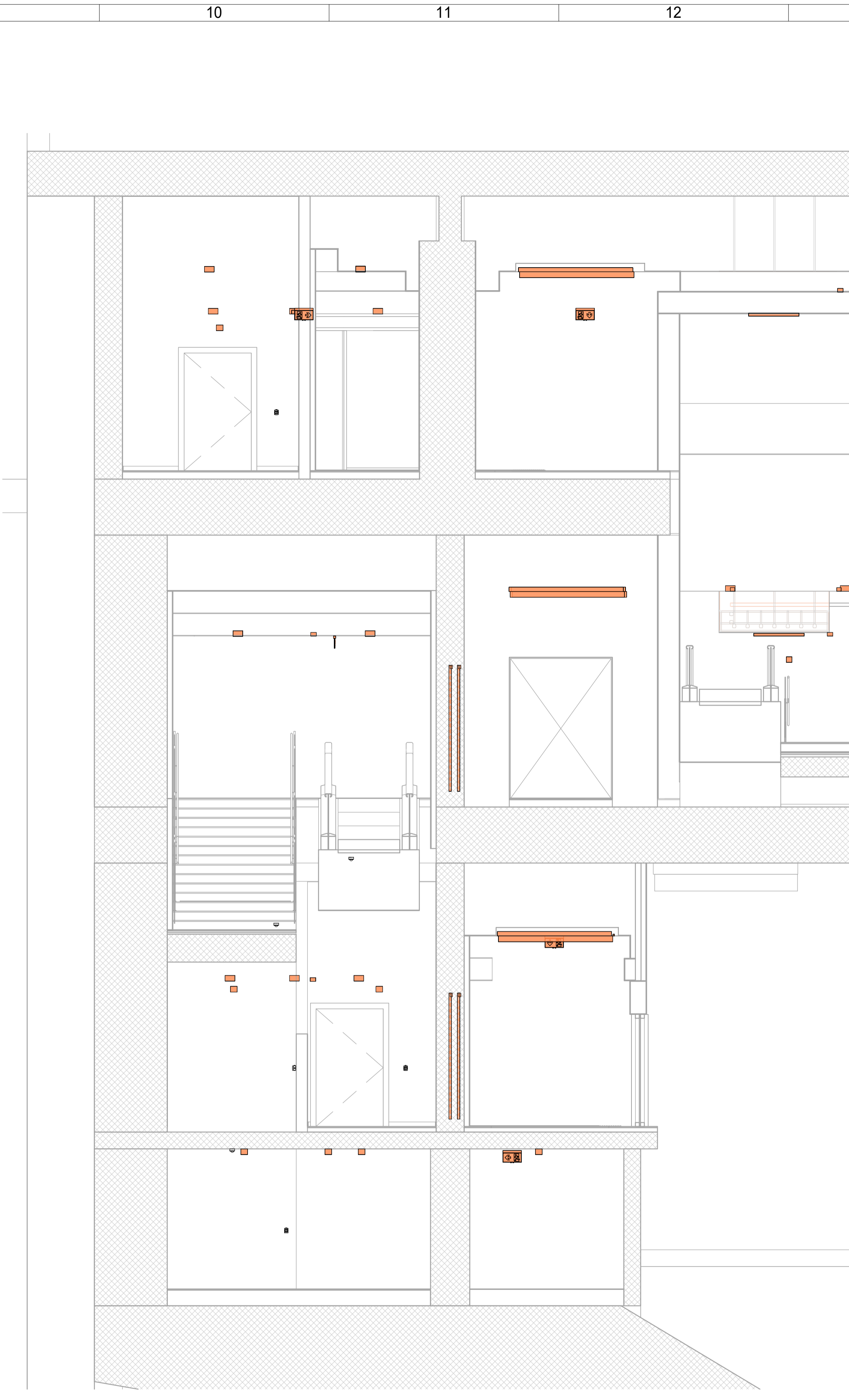
B Impianto Illuminazione - Sezione B-B 1 : 50