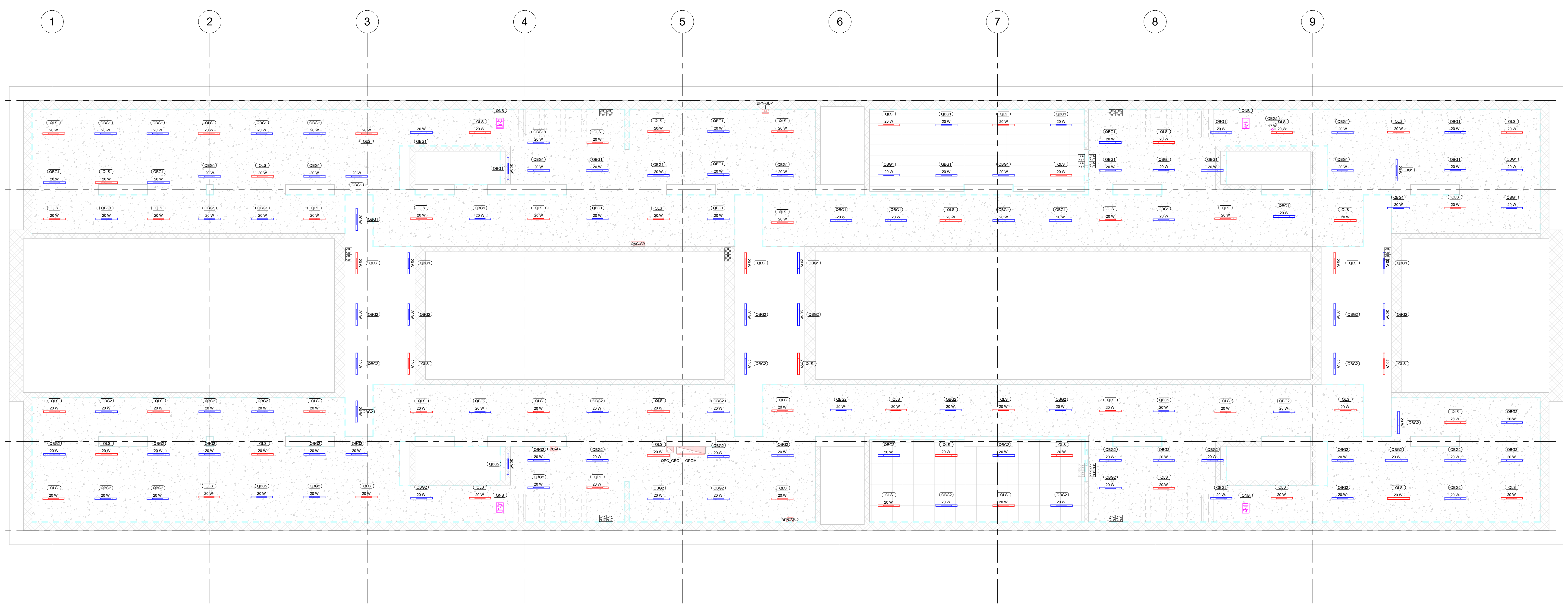
1 Piano sottobanchine - Illuminazione 1 : 100