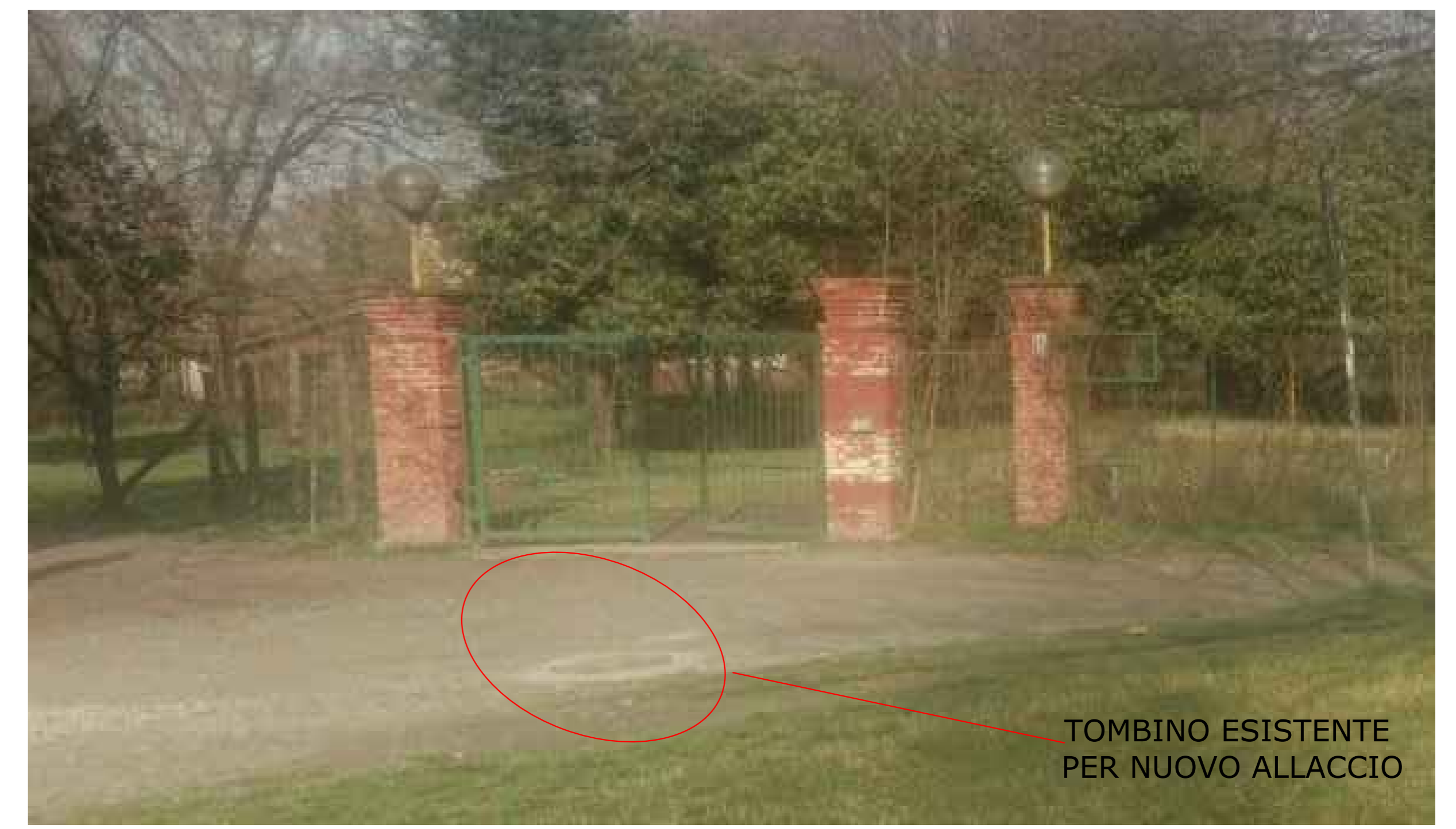
TOMBINO ESISTENTE PER NUOVO ALLACCIO