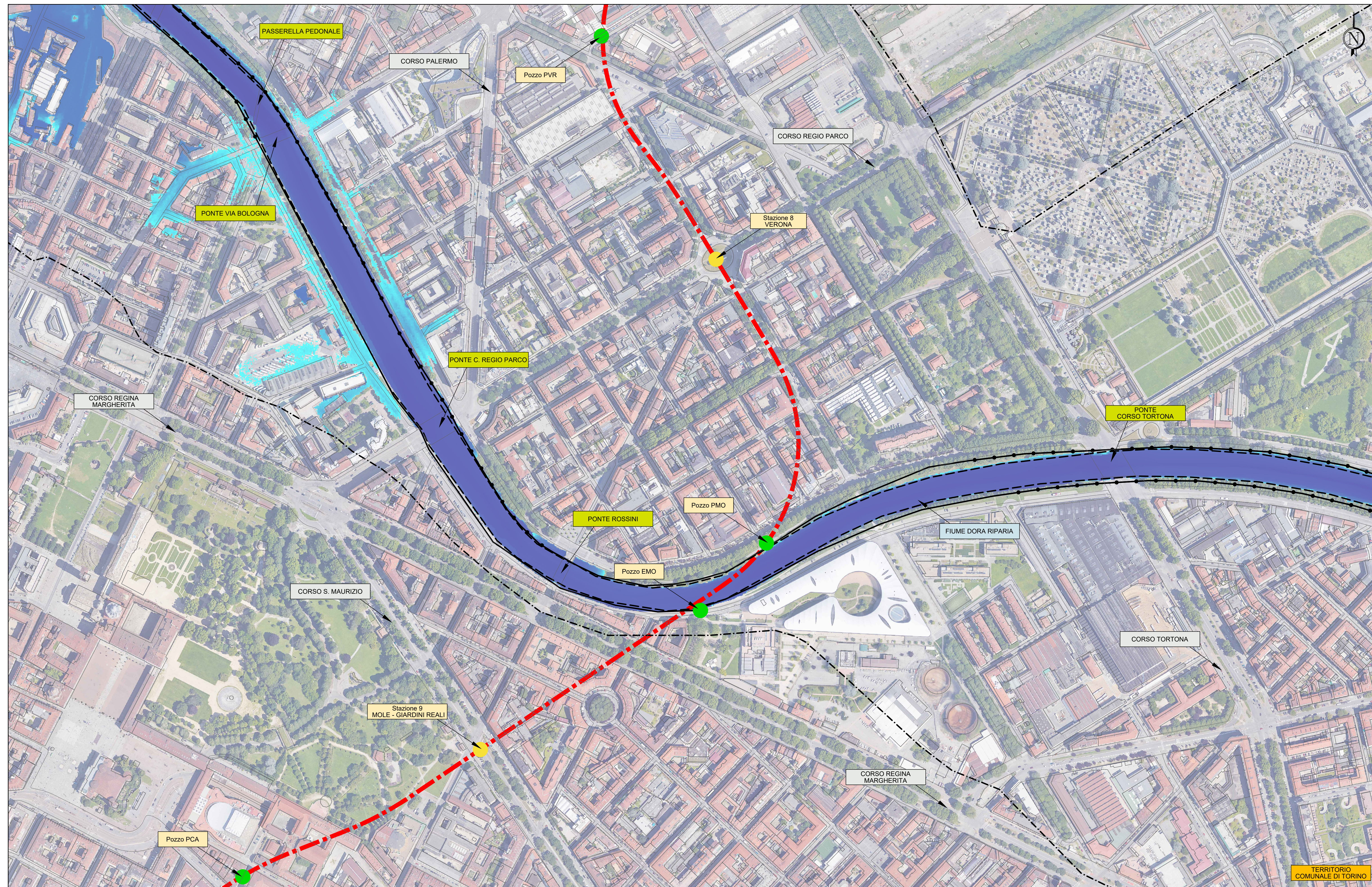
TIRANTI IDRAULICI MASSIMI PER UN EVENTO DI PIENA TR 200 ANNI, IN CONDIZIONI ATTUALI IN ASSENZA DI CASSA DI LAMINAZIONE A MONTE E PARZIALE OSTRUZIONE DEL PONTE DI CORSO REGIO PARCO Base carta: BDTRE Regione Piemonte, Ortofoto