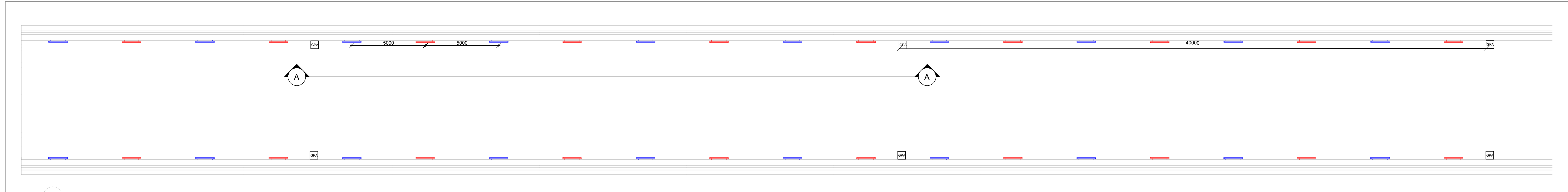
1 Impianto di Luce e Forza motrice - Layout di linea 1 : 100