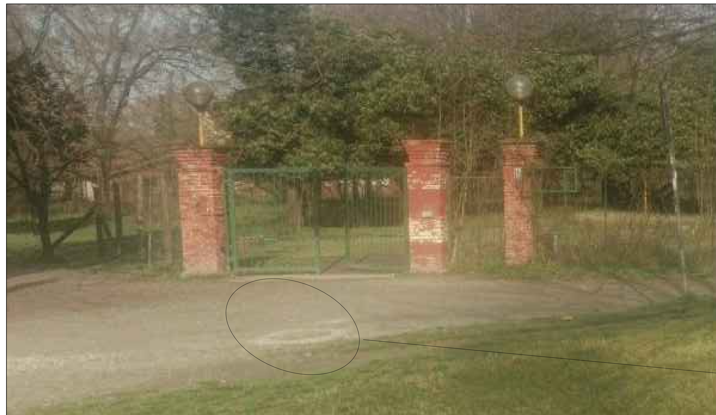
TOMBINO ESISTENTE PER NUOVO ALLACCIO