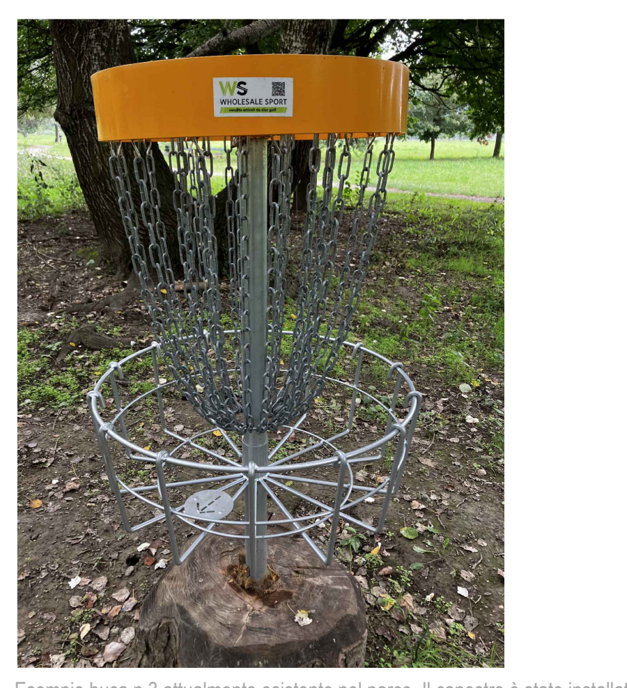
Esempio buca n.3 attualmente esistente nel parco. Il canestro è stato installato utilizzando una sezione lignea proveniente da albero morto.