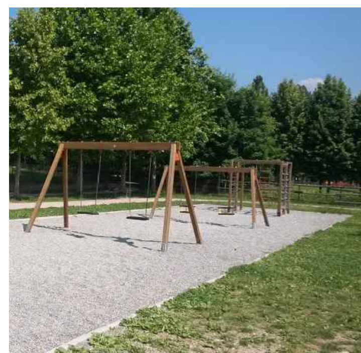
IMMAGINE DI RIFERIMENTO

Per il dettaglio costruttivo si veda il riquadro a destra.