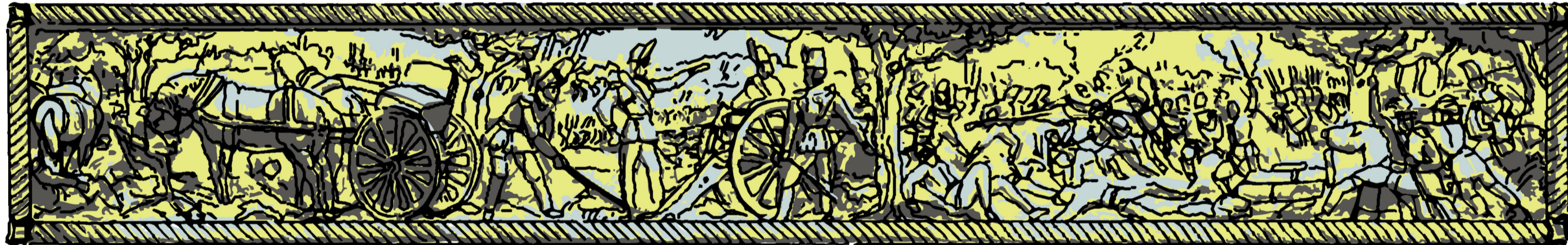
05 Bassorilievo - Fronte Sud SCALA 1:10