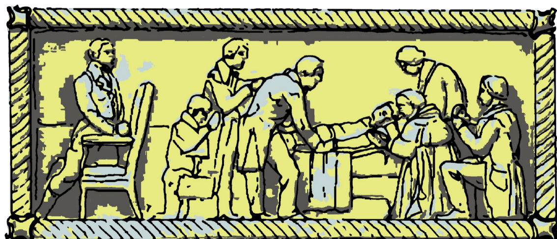
07 Bassorilievo - Fronte Est SCALA 1:10