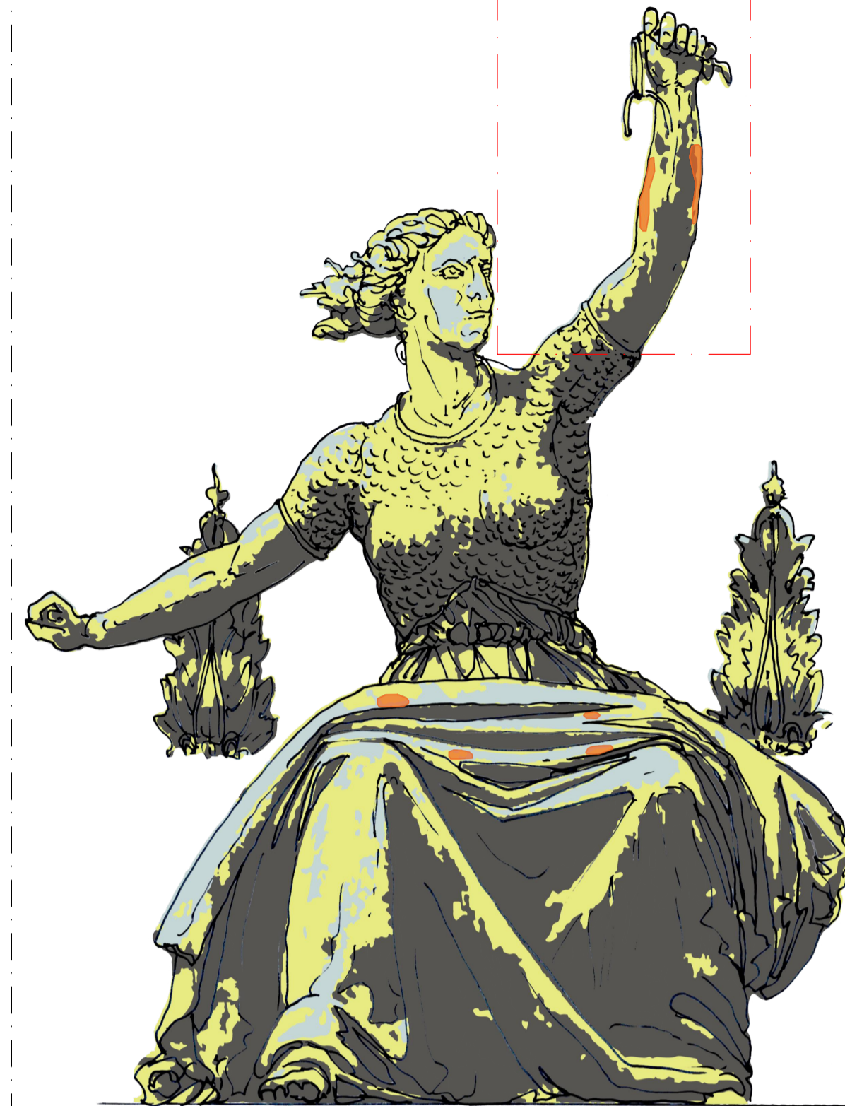
04 Equaglianza civile - Fronte Nord SCALA 1:10

MANCANZA DI ELEMENTI DECORATIVI Libertà: Ricostruzione dei ceppi spezzati nella mano sinistra.