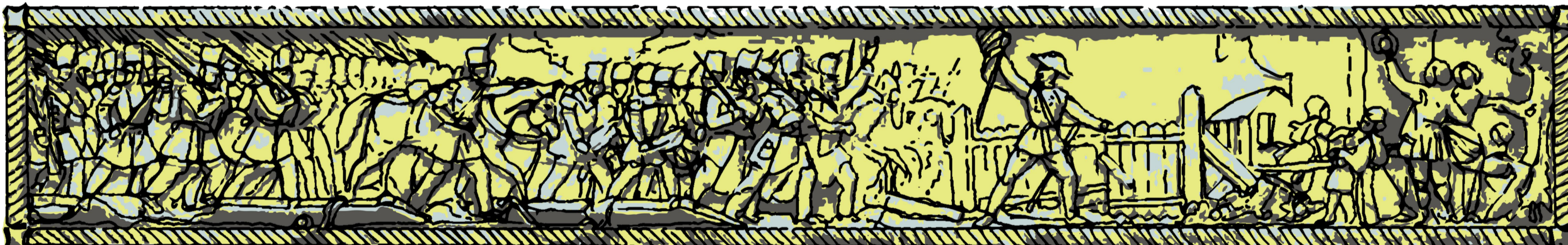
06 Bassorilievo - Fronte 3 SCALA 1:10