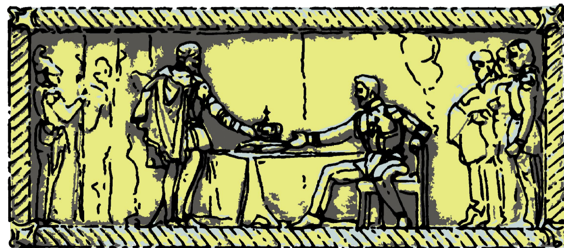
08 Bassorilievo - Fronte Ovest SCALA 1:10