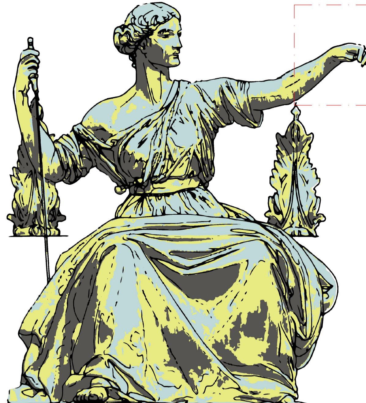
03 Libertà - Fronte Sud SCALA 1:10

MANCANZA DI ELEMENTI DECORATIVI Martirio: Non sono presenti elementi da integrare o ricostruire.