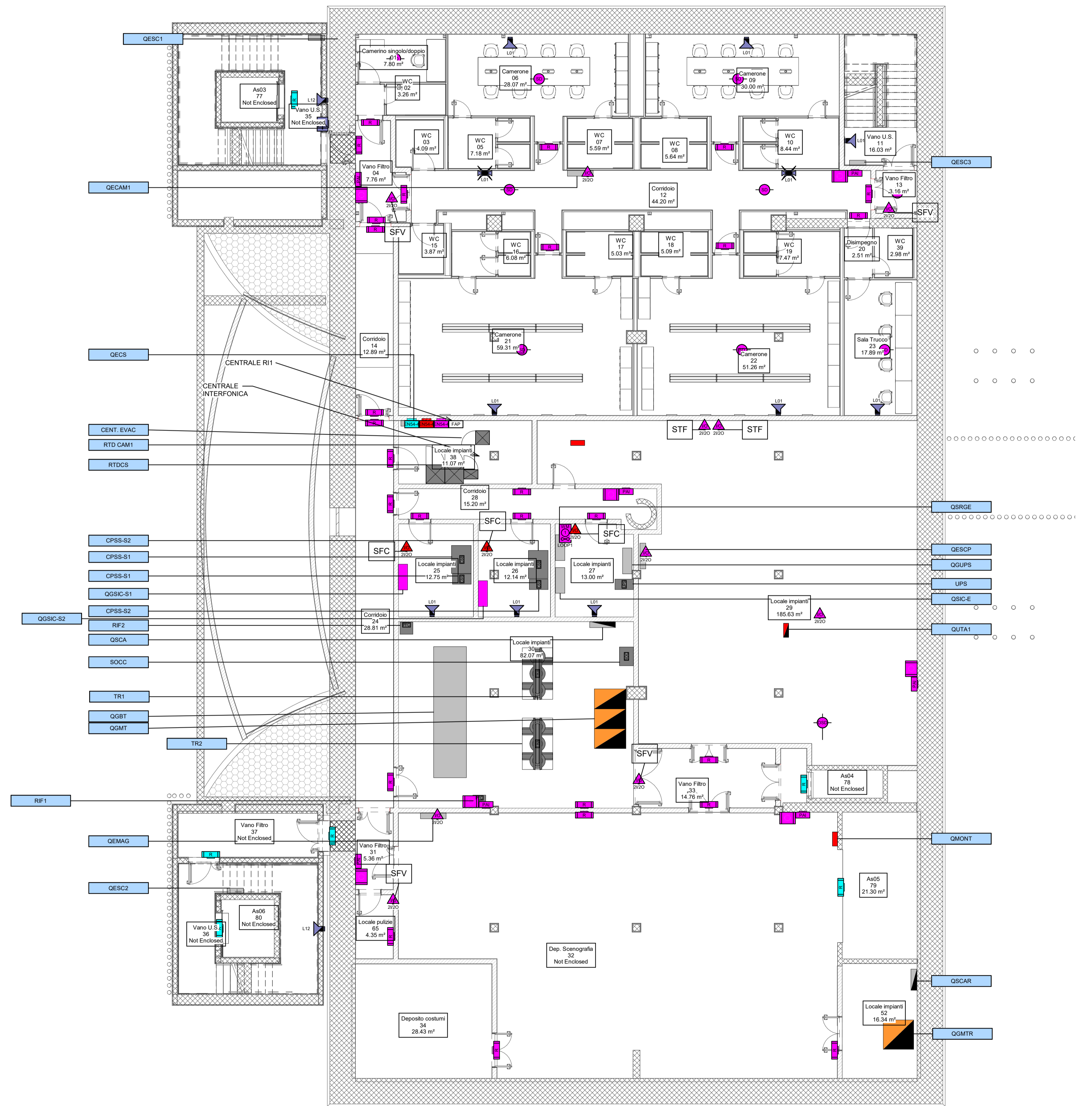
2 Pianta interrato -2 1: 100