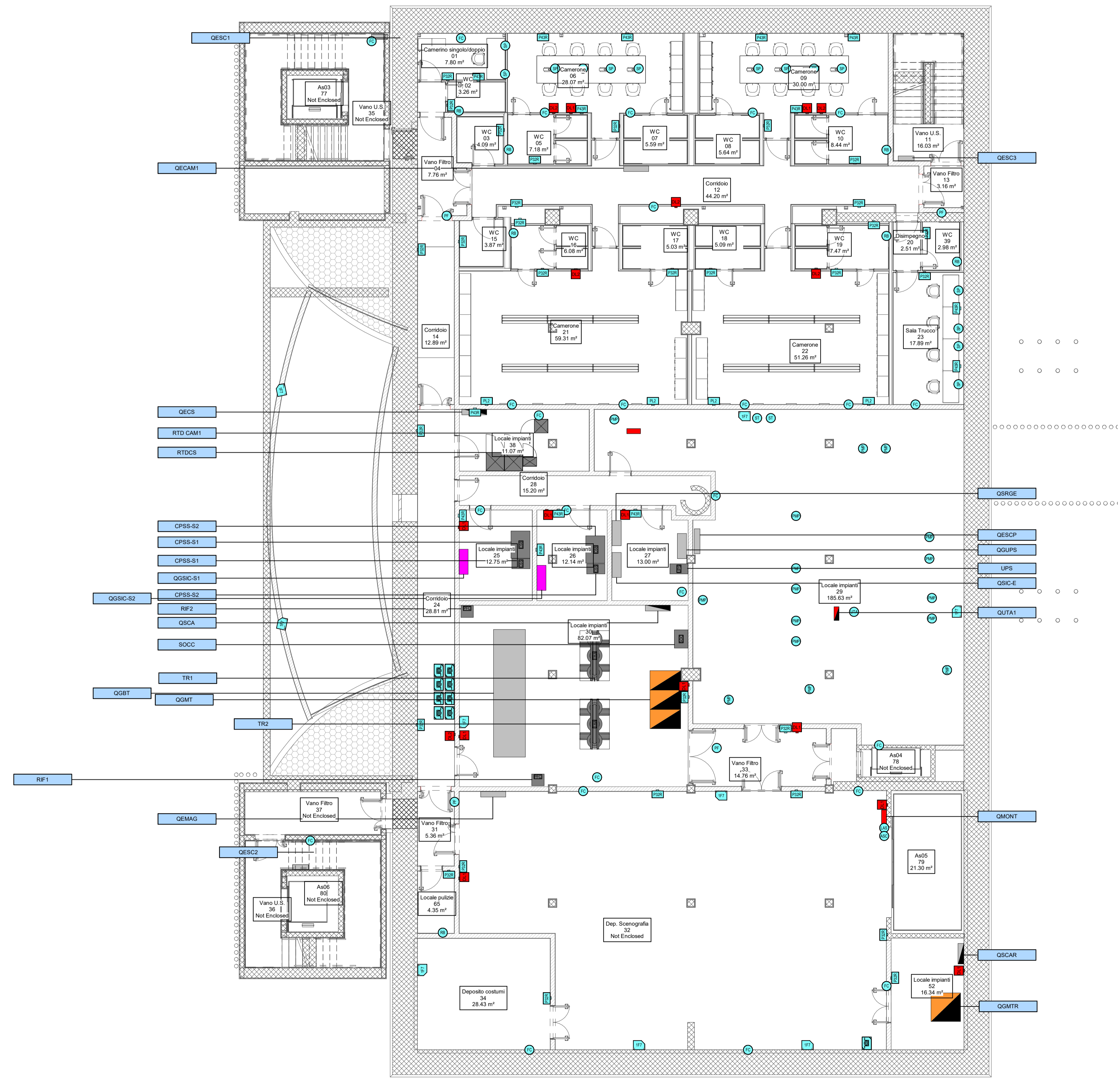
2 Pianta interrato -2 1 : 100