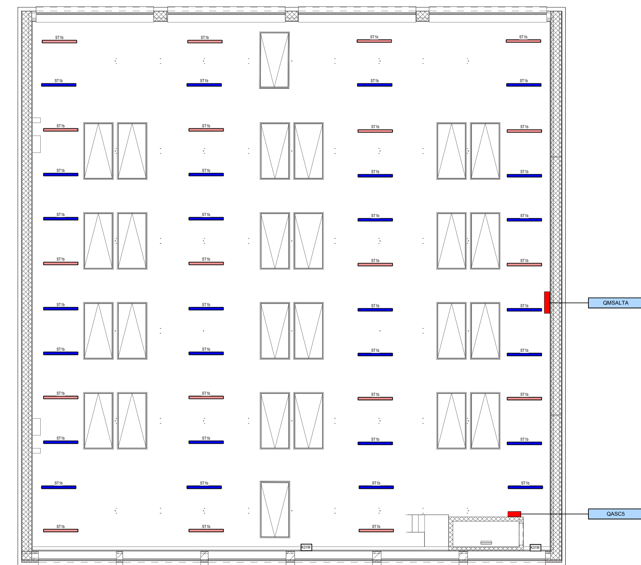
3 Piano Torre scenica sopra graticcio 1 : 100

NOTE TUTTI GLI APPARECCHI ILLUMINANTI RAPPRESENTATI DI COLORE ROSSO SI INTENDONO LAMPADE ALIMENTATE DA CIRCUITO DI SICUREZZA "UPS" DEDICATO. TALI LAMPADE DOVRANNO ESSERE COMANDATE INSIEME ALLE LAMPADE PER ILLUMINAZIONE ORDINARIA. L'IMPIANTO LUCI BLU, COMPOSTO DA APPARECCHI ILLUMINANTI A FLUSSO COSTANTE DEDICATI ALL'ILLUMINAZIONE DISCRETA DELLE AREE FUNZIONALI AL PALCO DURANTE LO SVOLGIMENTO DEGLI SPETTACOLI È STATO STRALCIATO DAL PRESENTE APPALTO COME DA ACCORDI INTERCORSI CON LA STAZIONE APPALTANTE. PERTANTO GLI APPARECCHI ILLUMINANTI "BCM" E "BVM" INDICATI SULLE PIANTE HANNO LO SCOPO DI ESSERE SOLAMENTE UNA INDICAZIONE FUNZIONALE.