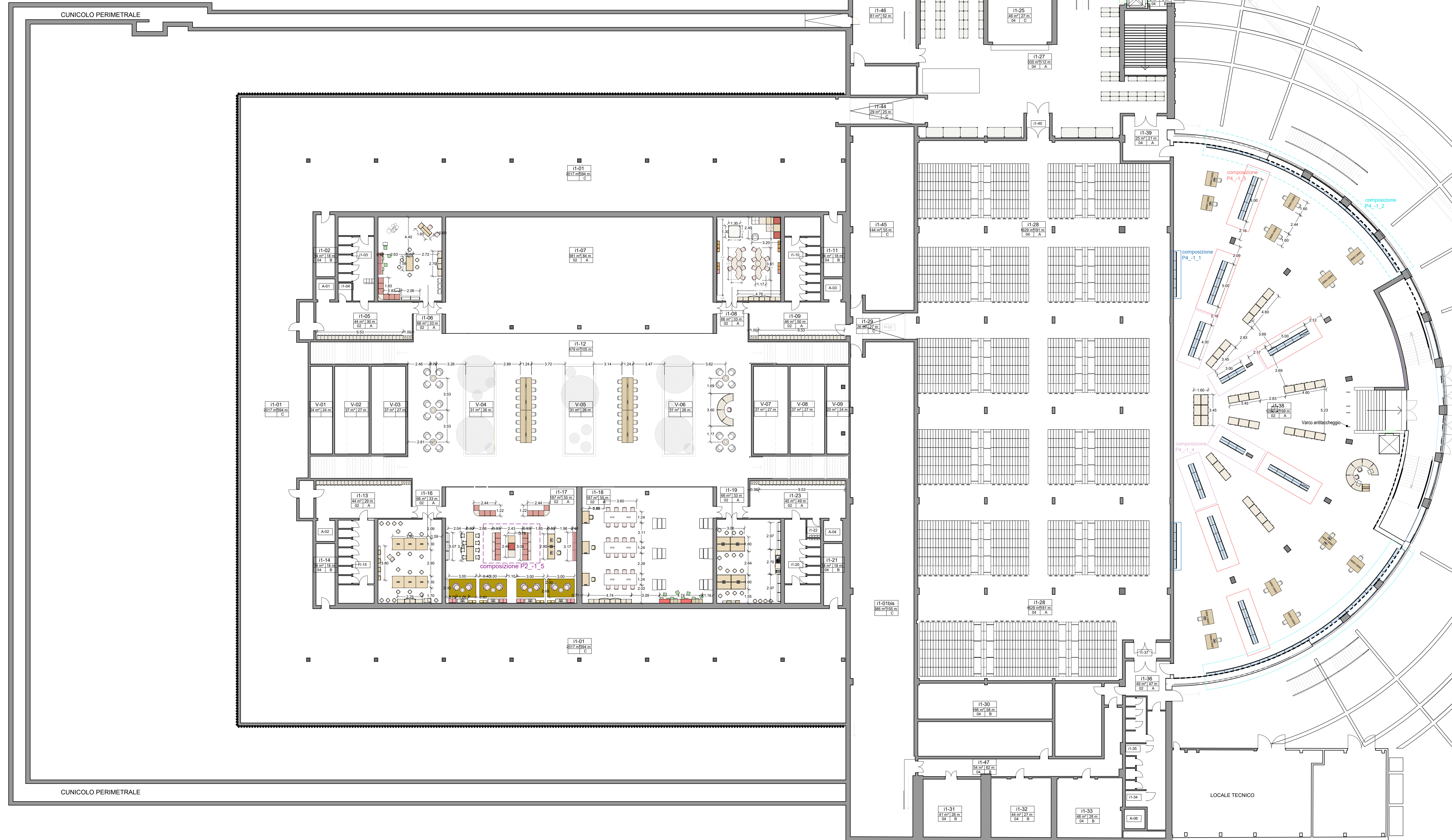
PIANTA PIANO INTERRATO SCALA 1:200