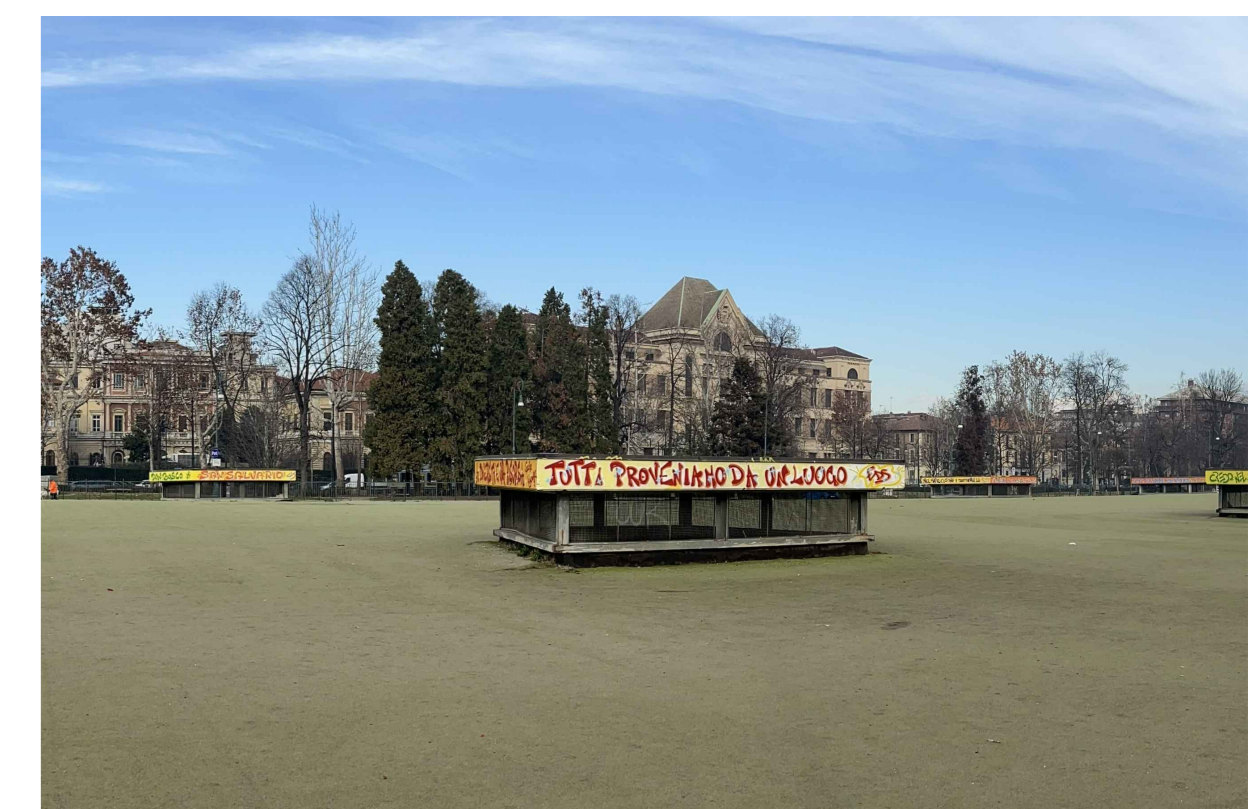
4 Presa di areazione