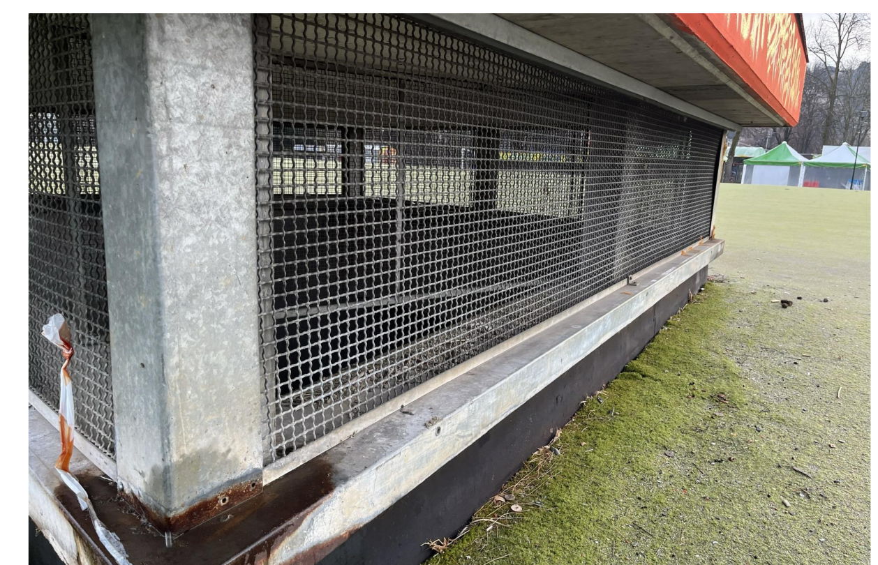
5 Presa di areazione, dettaglio vista esterna