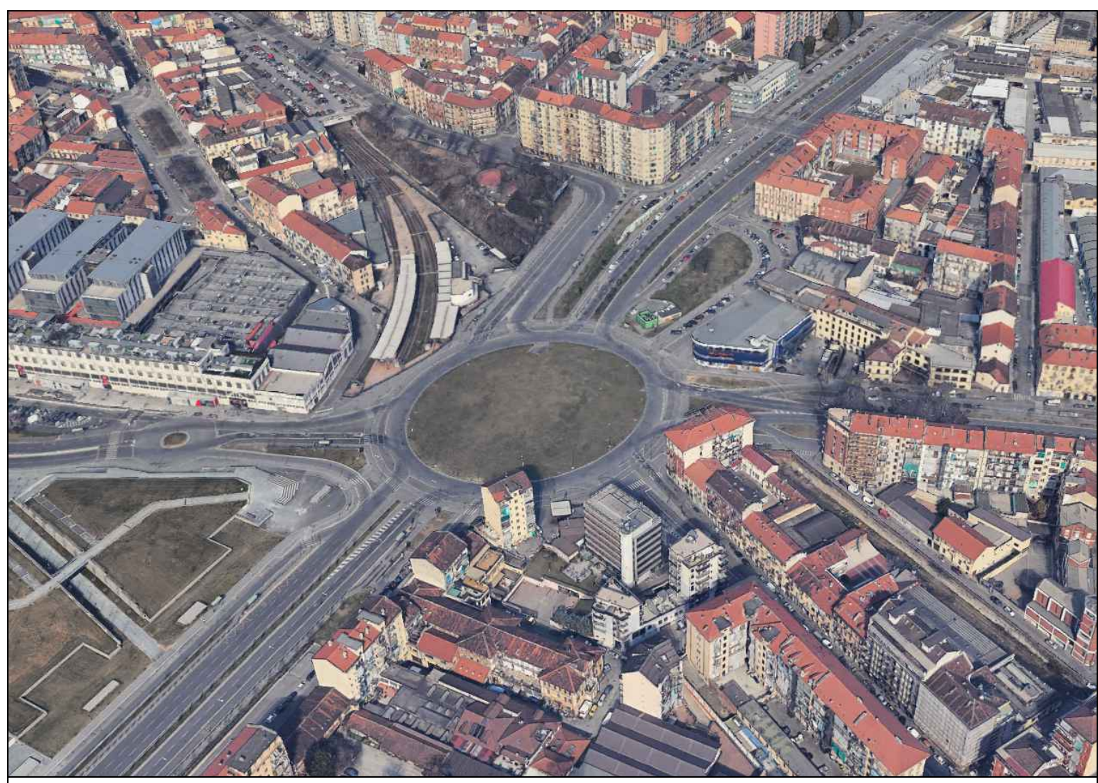
Stato di fatto - estratto di Google Earth