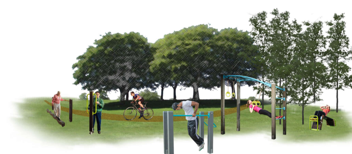
4 Aree fitness inclusive