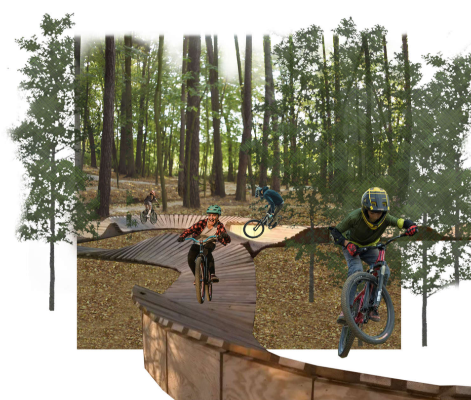
5 Pump track