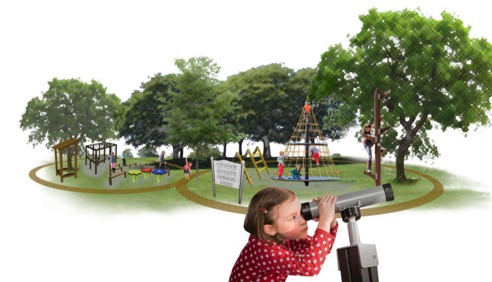
3 Aree gioco inclusive