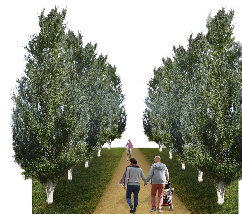
1 Viali alberati