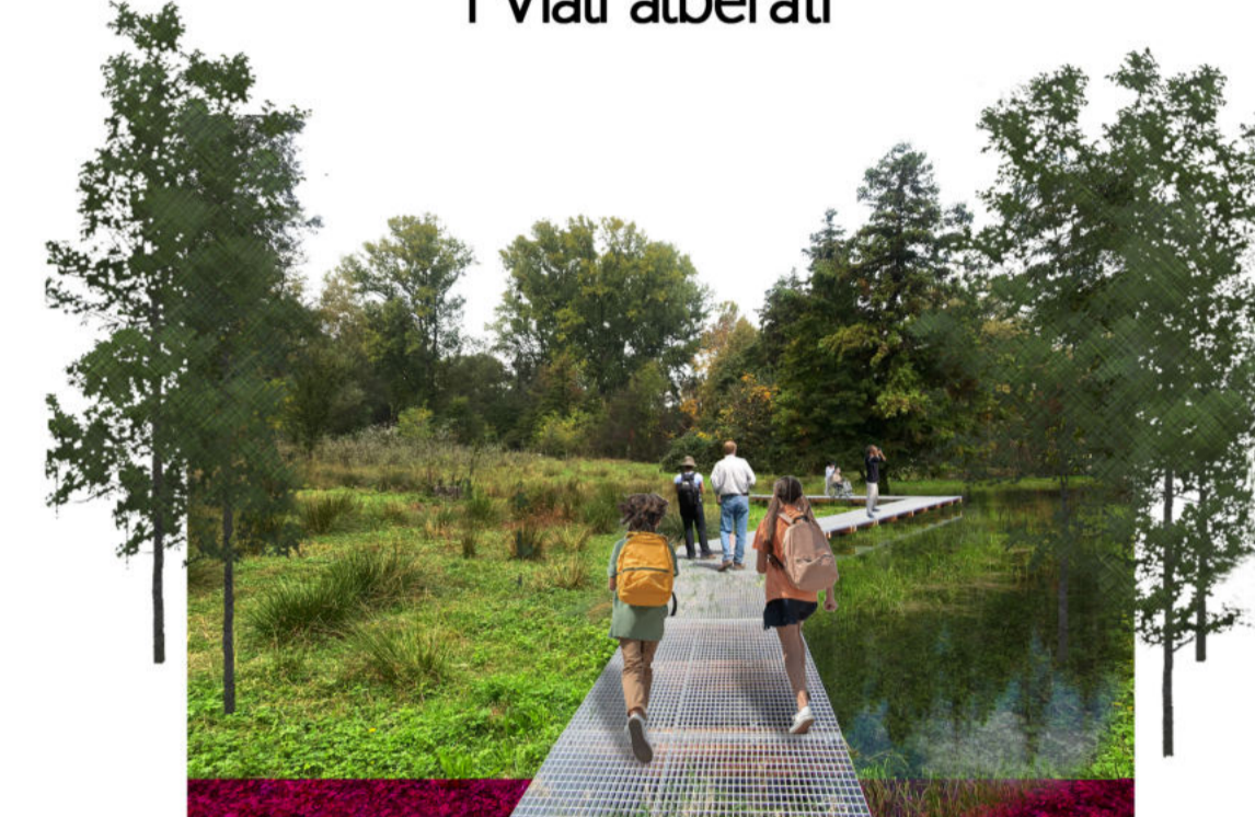
2 Percorso didattico