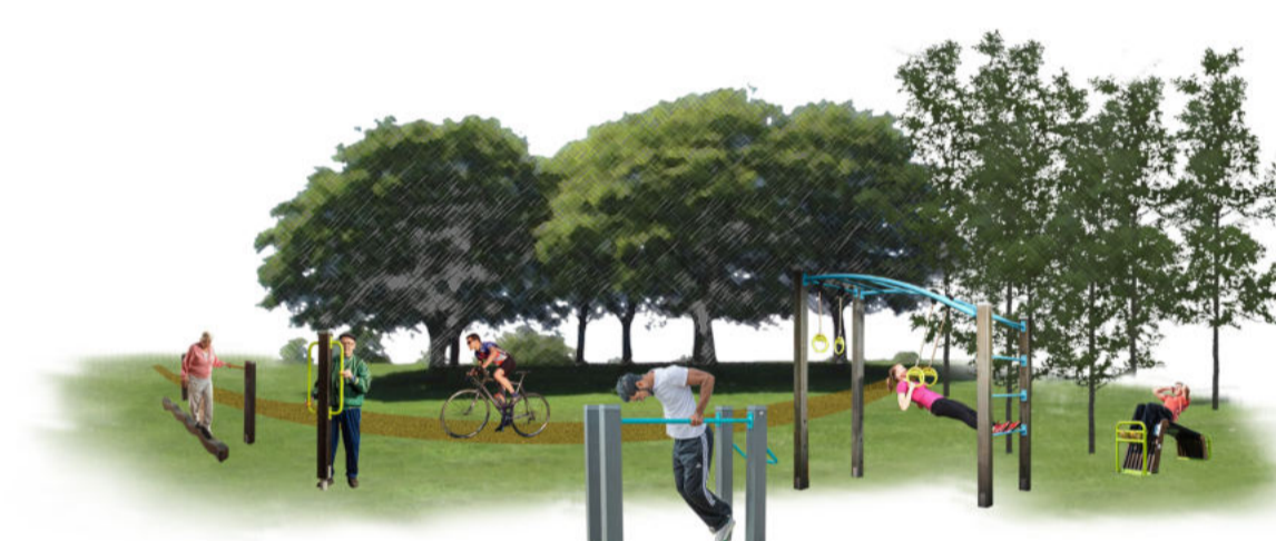
4 Aree fitness inclusive