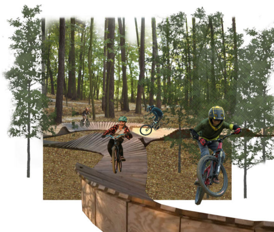
5 Pump track