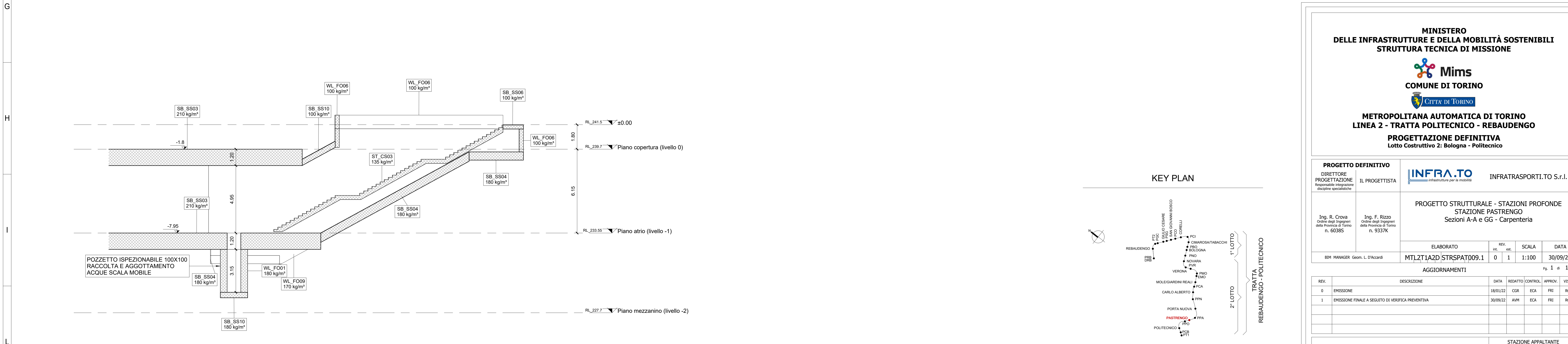
2 SEZIONE G 1 : 100