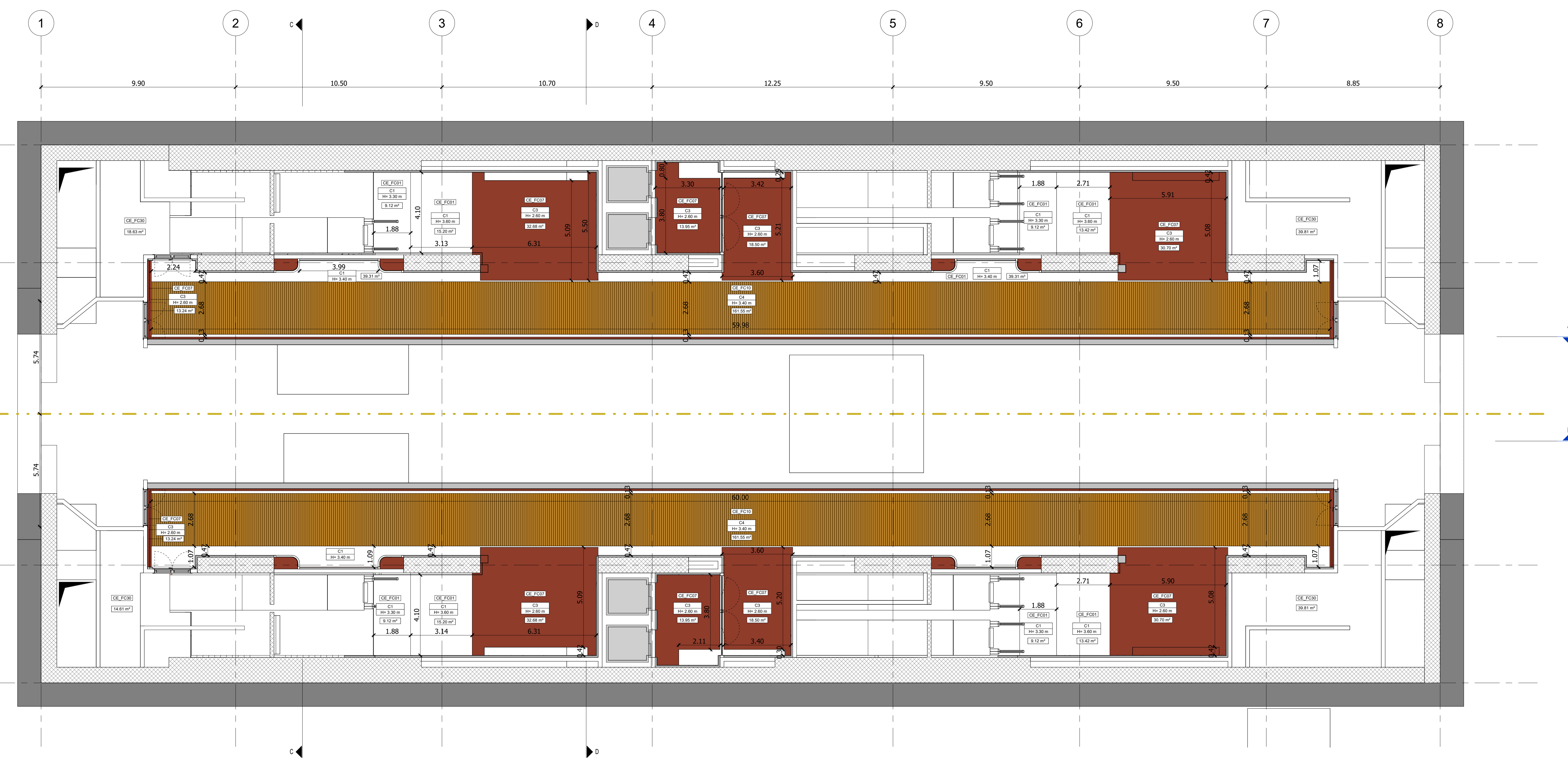
2 Piano banchina (livello -4)