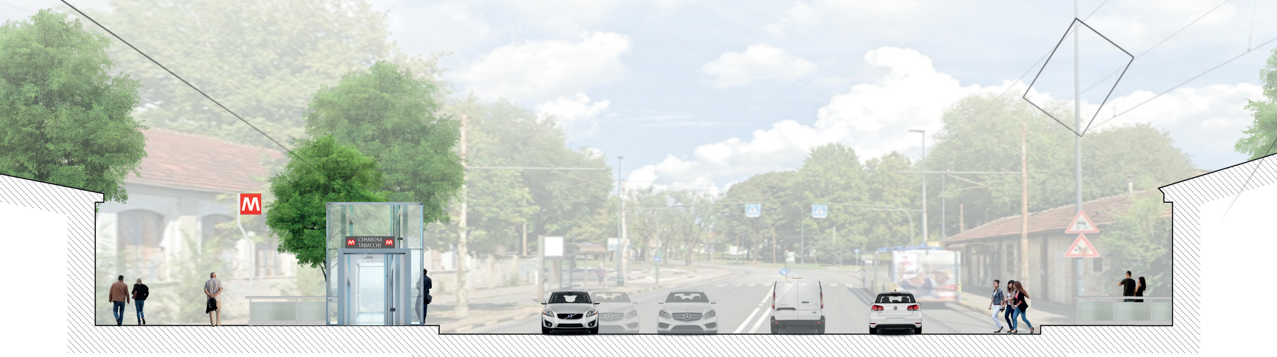
SEZIONE A-A SCALA 1:200