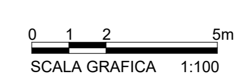
1 PIANTA ATRIO 2/2 1:100