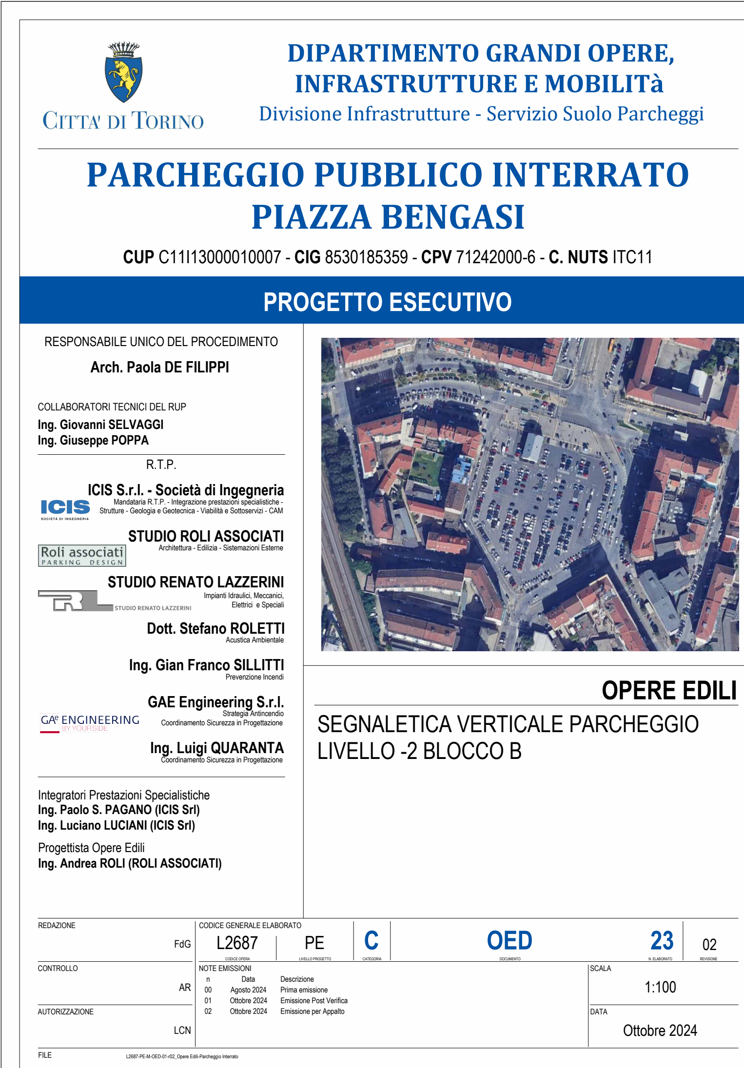
PIANTA LIVELLO -2 Blocco B 1 : 100

NOTA Ai sensi dell'art. 102 comma 1 lett. c) del D.Lgs. 30/2023, in opere relative alla segnaletica orizzontale dei piani interrati del parcheggio (iv. -1, -2, -3), alla segnaletica verticale sulla porta di tutti i livelli del parcheggio, sono stati adottati i colori di riferimento per la segnaletica di sicurezza e non sono stati adottati i colori di riferimento per la segnaletica di sicurezza. Si riserva la possibilità di affidare tali opere in un secondo tempo, successivo all'aggiustazione del presente Appalto.