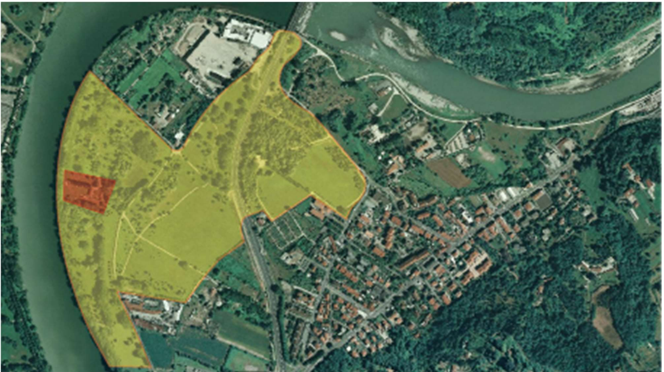
Aree di progetto: Cluster 1 (giallo), Cluster 2 (rosso)

Segue un'immagine con la divisione tra le particelle catastali a cui afferiscono i due cluster, secondo la seguente lista: