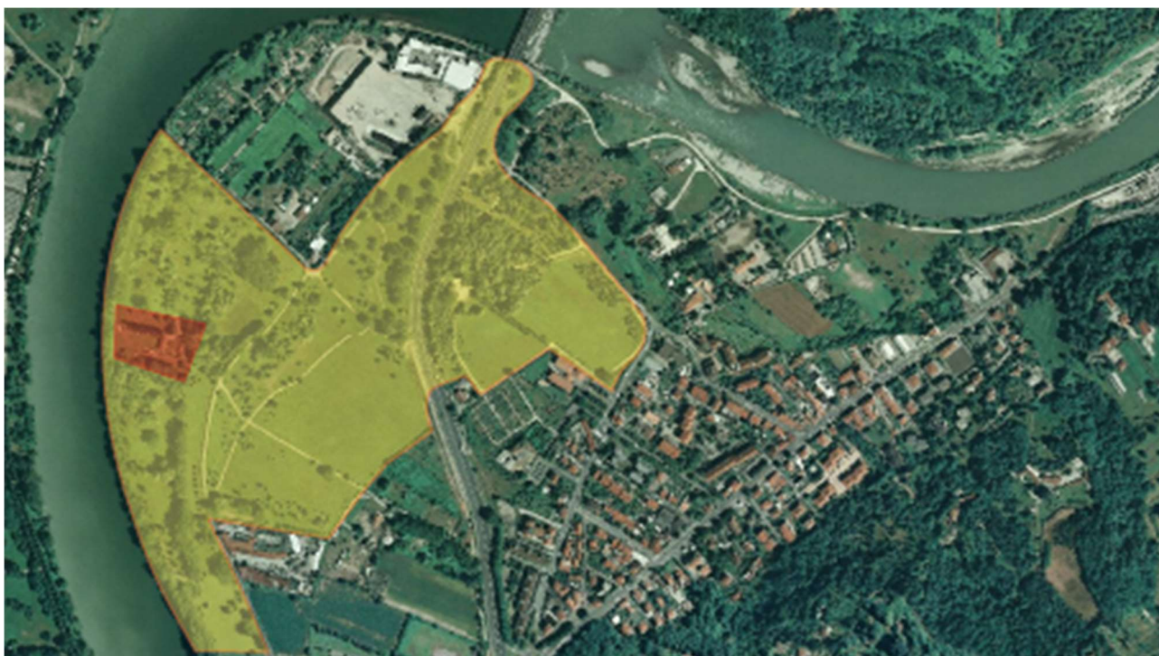
Aree di progetto: Cluster 1 (giallo), Cluster 2 (rosso)

Segue un'immagine con la divisione tra le particelle catastali a cui afferiscono i due cluster, secondo la seguente lista: