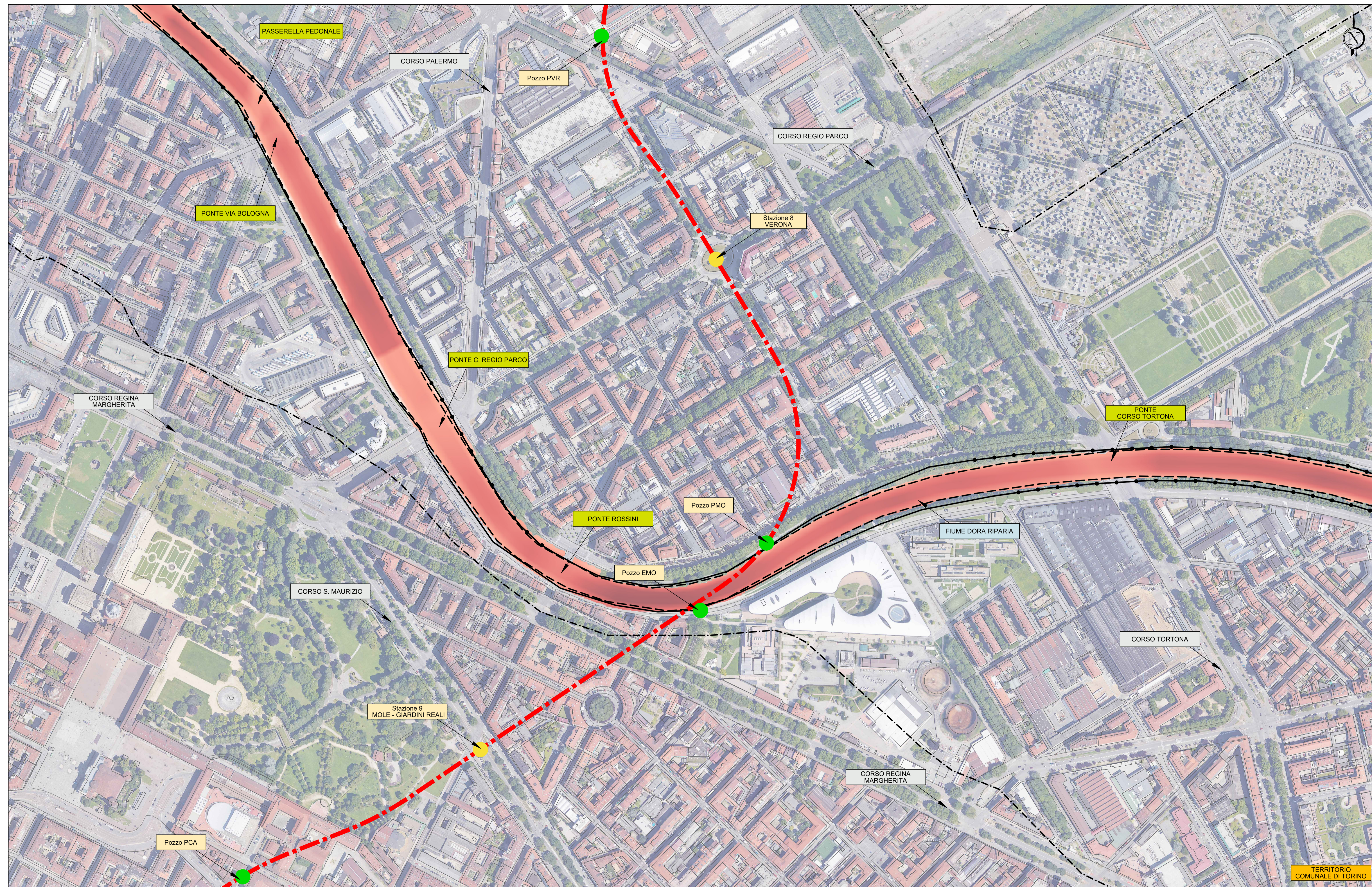
VELOCITÀ DI DEFLUSSO MASSIME PER UN EVENTO DI PIENA TR 100 ANNI, IN CONDIZIONI ATTUALI IN ASSENZA DI CASSA DI LAMINAZIONE A MONTE Base carta: BDTR Regione Piemonte, Ortofoto Scala 1 : 2.500