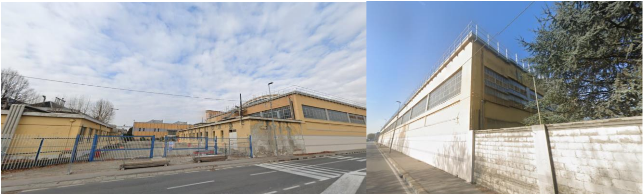
Figura 3 - Vista ingresso

Vasca (97) A nord dell'aviorimessa è presente una vasca interrata e scoperta di raccolta acque.