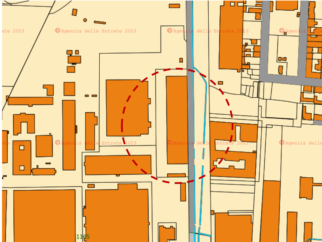
Figura 2-Planimetria Catastale

L'area oggetto di intervento, di proprietà del Politecnico di Torino, è sita su Corso Francia n.426 a Torino, individuata al Catasto Fabbricati al foglio n. 1165, particella 64, costituita attualmente da 5 distinti manufatti collegati tra loro.